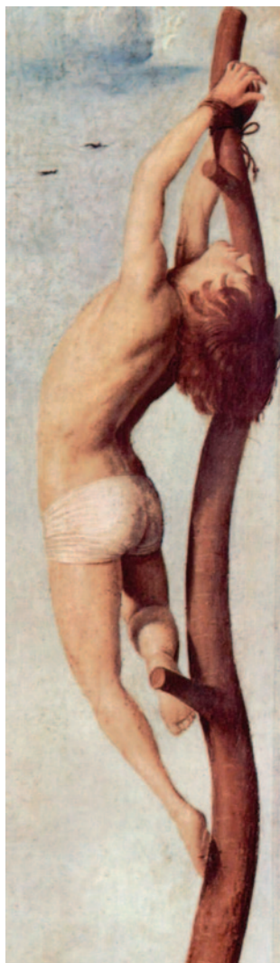
ANTONELLO DA MESSINA (Antonello di Giovanni di Antonio) Crucifixion, 1455

a megvallásodáshoz hasonlóan a szerelem vakká és süketé tesz, és gyakran alaposan el is butít. A barátság körében az Én, a tisztánlátás, az intelligencia nemcsak megmarad, hanem tökéletesedik.