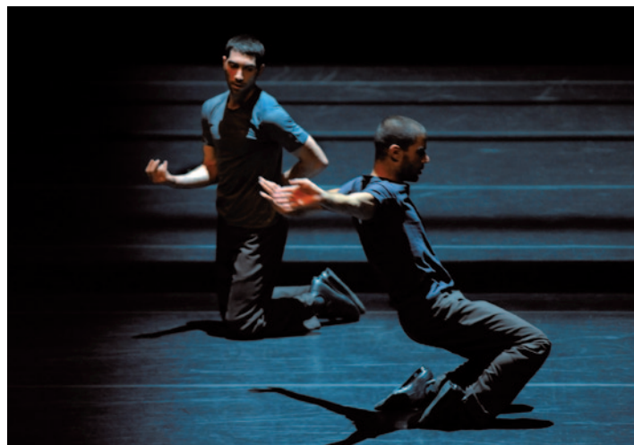
EMANUEL GAT DANCE Téli variációk