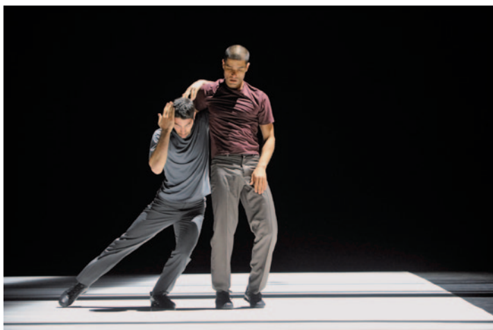
EMANUEL GAT DANCE Téli variációk