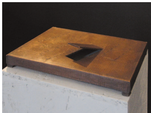
KÖRÖSNÉNYI TAMÁS A művészet él, B7, 2008, bronz, 5,7 × 22 × 16 cm

get, ami a továbblépéshez szükségeltetett. A rajz ugyanilyen módon a tervezésre, ábrázolásra, innovációra alkalmas dolog, a munkám pedig ezt a lehetőséget kívánja bemutatni. A következő teremben az alapítók és az adományozók portréi láthatók. Itt van Füst Milán hagyatéka is, tehát eleve van a kiállításban már egy kiállítás. Ez a terem is olyan, mint a Széchenyié. Volt egy úr, Elischer Boldizsár jogtudós, aki azon a képen látható, és akinek az volt a mániája, hogy Goethe-relikviákat gyűjtött, és azt hiszem, több ezer van belőle. Ha azt a két munkát ( Hiány, 1980, Érem, 1980 ) nézzük, ami ebbe a terembe került, lényegét tekintve nem változott a gondolkodásom 1980 óta. Ezek is negatívok és pozitívok, az egyikken valaminek a helye látható, a másikon pedig egy pozitív forma.