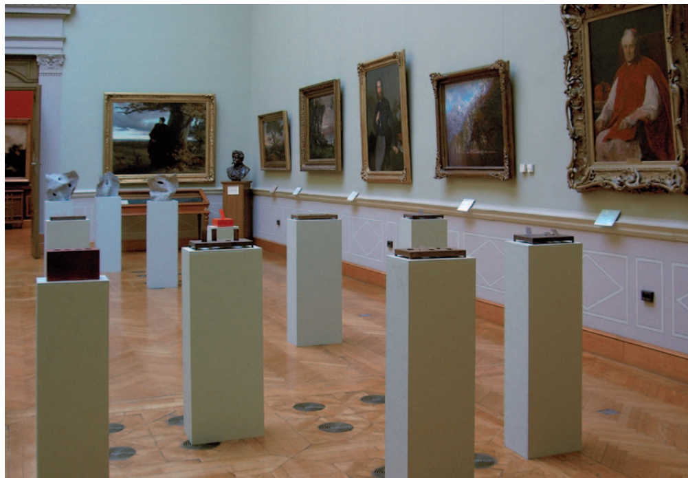
KÖRÖSÉNYI TAMÁS A művészet él, 2010, részlet a kiállításról; Magyar Tudományos Akadémia, Művészeti Gyűjtemény; © fotó: Fórián Szabó Noémi

☒ Így is lehet, de én csak példákat akartam felhozni. Biztos végtelen számú variáció lehetséges. Lehet, valami lehet benne, hogy emlékeztetnek a műcsarnoki Szellemeim -re, azt is én csináltam, ezt is én csináltam, de alapvetően itt most barlangra gondolok. A barlangokat hátulról sohasem látjuk, és engem ez érdekel. A szobrászat alapvetően emberábrázolás, ezek az emberi gondolkodás ábrázolásai. Az emberi gondolkodás pedig mindig új összefüggéseket keres.