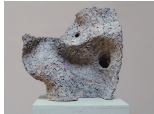
KÖRÖSÉNYI TAMÁS Az emberi szellem kiterjesztett tere, B4 – Két egyszerű barlang összekötő folyosókkal, 2009, vas, papír, 39 × 40 × 25 cm; fotó: Körösesny Tamás

☒ Igen, picit van benne ilyen is. Ezekhez a munkákhoz az újságpapír volt az adekvát.