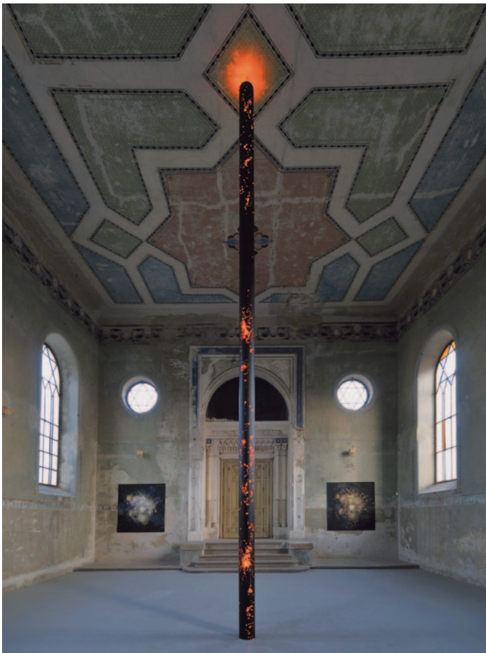
SOMORJAI KISS TIBOR Objekt, 2009, At Home Gallery, Somorja/Samorin

„Egy híres tudós (többek szerint Bertrand Russel) ismeretterjesztő előadást tartott a csillagászatról. Érzékletesen elmondta, hogyan kering a Föld a Nap körül, a Nap pedig a galaxisunkat alkotó hatalmas csillaghalmaz középpontja körül. Az előadás végén a hátsó sorban felállt egy apró, idős hölgy, és így szólt: Mit fecseg itt össze-vissza nekünk? A Föld a valóságban lapos és egy óriási teknősbéka hátán nyugszik. – No és mi tartja a teknősbékát? – mosolygott fölényesen a tudós. – De okos maga fiatalember, hű, de okos – válaszolt a néni. – Egyszerű: egy másik teknősbéka. Azt megint egy másik, és így tovább.” (S. W. Hawking)»