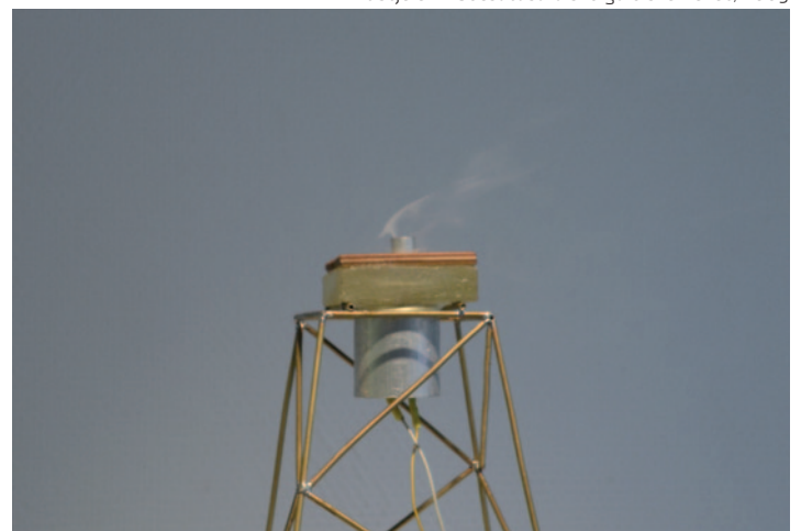
JANEK SIMON Füstjelek kibocsátására szolgáló szerkezet, 2009