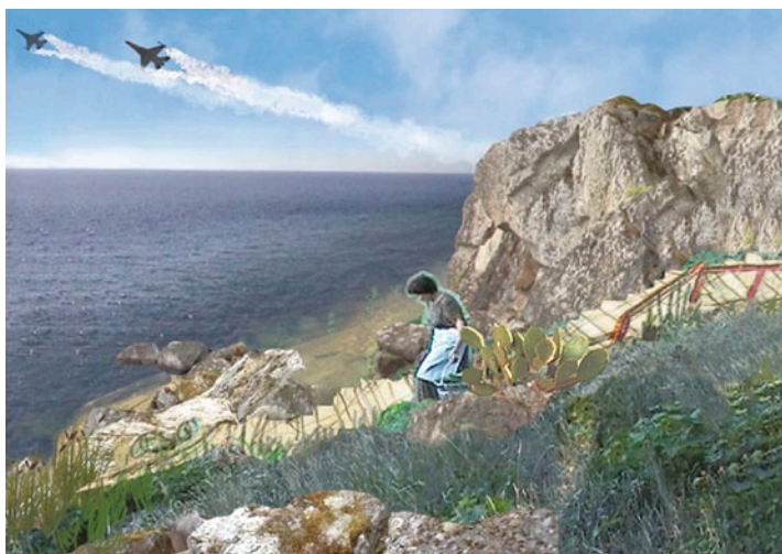
ULU BRAUN Fish Soup , 2006, DV, 10 min

A szervezőket dicséri a korábbi évek gyakorlatához hasonlóan a nemzetközi kontextus megteremtése a magyar művészek munkái számára, valamint a kiállítások mellé szervezett kísérőprogramok, legyenek azok szakmai workshopok, előadások vagy koncertek. Az egyes kiállítások mellé szerkesztett kísérőanyag pedig már tényleg csak hab a tortán, még akkor is, ha oly kevés az érdeklődő közönség.