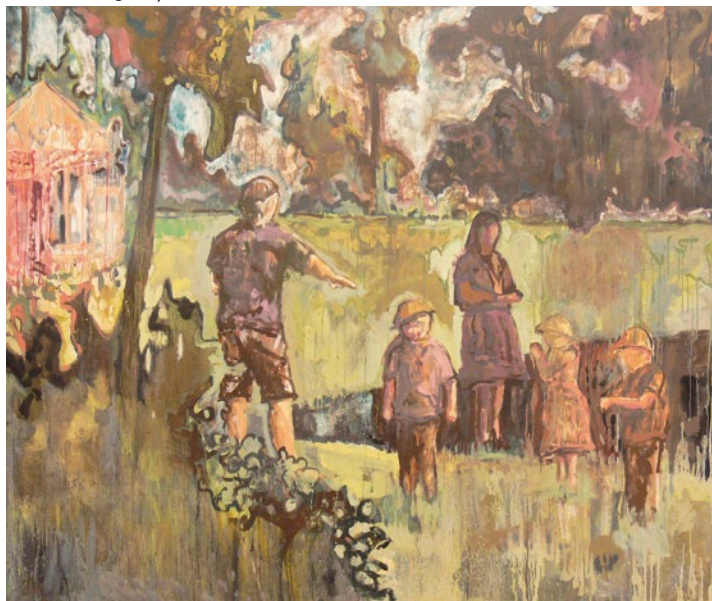
CSIK RICHÁRD Parkban, 2009, olaj, vászon