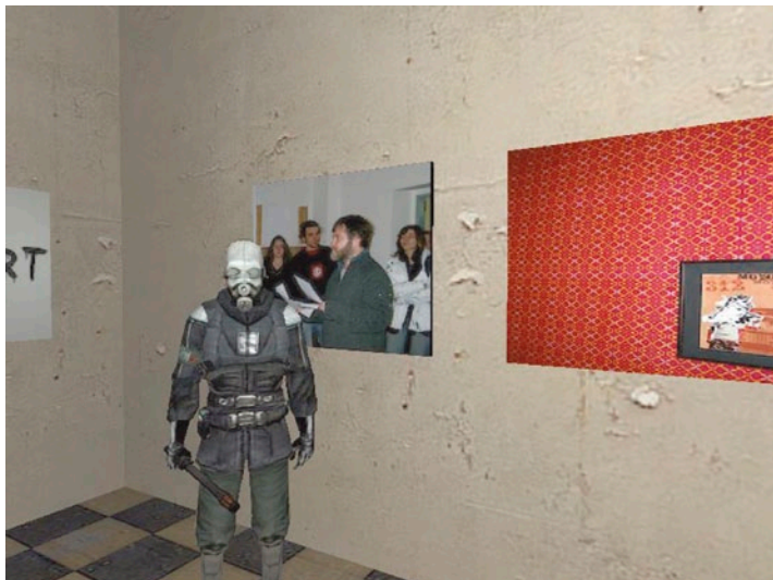
STANISLAV VESELOVSKÝ Half-Life 2: Reklama , 2007, screen capture, 9:25 min