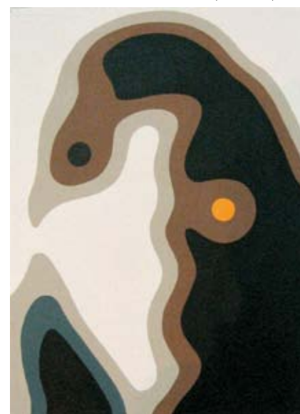
NOVICZKI KATALIN Arc, Madaras, 2008