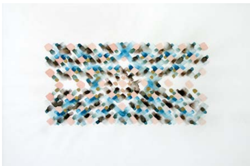
VERCZ SZILVIA Transzparencia és ismétlődés, 2008