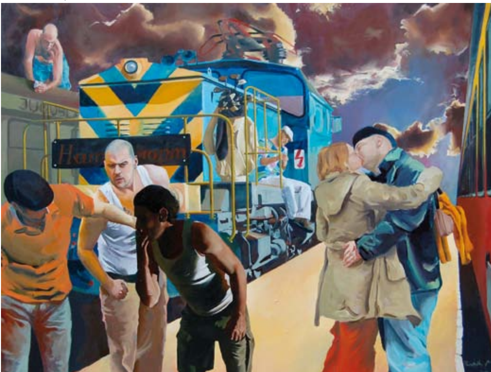
PINCZEHELYI ANDRÁS Pályaudvar, 2007, olaj, vászon, 170 x 225 cm

fekete-fehér („a múlt”), illetve színes („a jelen”) filmszalagot imitálva mutat közismert arcokat, szintén a portré műfaját analizálja, felvetve a másolás, az ismétlés, az egyéni hozzáátétel időben újrendezőző kérdéseit.