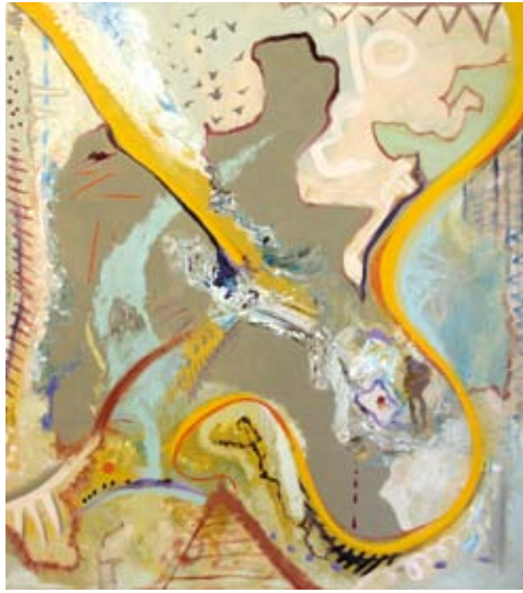
KÖNYVÁSÓ LÁSZLÓ Cím nélkül, 2008