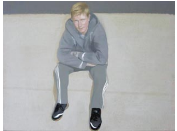
Sudár Péter Gábor KRISZ, 2008, olaj, vászon, 97×130 cm

lettek e kettős világ szimbólumai. Ezek a még működő tárgyak egy letűnő kor szellemét idézik: a néző – különösen ha a magyar poszt-kommunista környezetből érkezik – könnyen ráhangolódik a vitrinbe tett üveghal vagy a spejzben eltett paradicsomlá suggalta illatokra, hangulatra, melyek egyben a művész gyerekkorát is korjelzik.