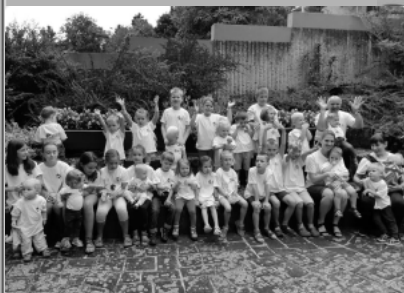
családos lelkigyakorlat Leányfalu