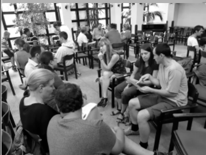
családos lelkigyakorlat Leányfalu