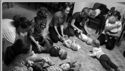
baba - mama klub