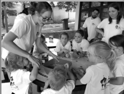
családos lelkigyakorlat Leányfalu