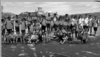
hittantábor Dömös - Esztergom