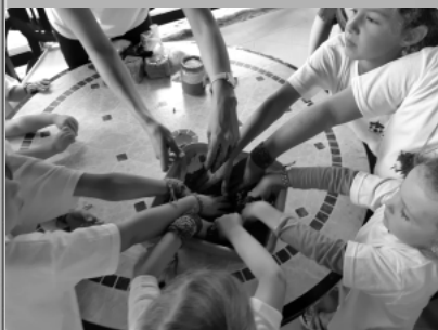
családos lelkigyakorlat Leányfalu