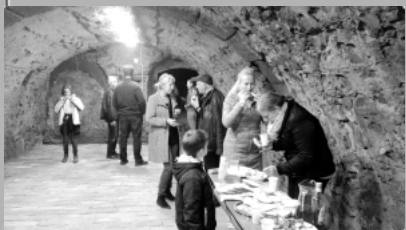
új közösségi tér a pincében