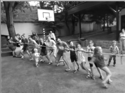
családos lelkigyakorlat Leányfalu