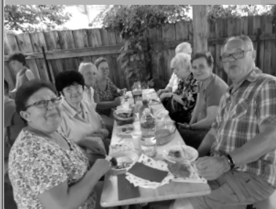
nyárbücsúztató a plébánián