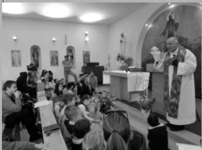
gyermekmise a Regőczipben