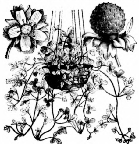
Fragaria indica .

2. Fragaria indica . — Indiai földi eper; szintén igen diszes függőnövény edényes tenyésztésre; virágai sárgák, gyümölcse piros, mint a mi vadon növekvő földi eprünknel.