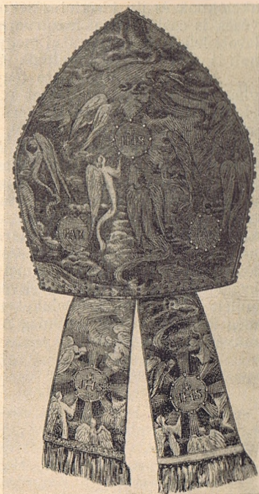
A Szentatya mitréja a Szentkapu bezárásánál.

Ezek az elvek és szempontok nemcsak kifejezik az Egyház felfogását és megfelelnek szükségleteinek, hanem teljesen földik a legkorszerűbb művészeti esztétika követelményeit. Tisztán művészi szempontból is tökéletesek s egybeesnek a szó igazi értelmében vett modern művészeti törekvésekkel. Ami természetes, hiszen a pápai rendelet világosan kimondja a liturgikus és a művészi szempontok összehangolásának elvét. Az Egyház mindig ezt az álláspontot foglalta el s az egyházművészet legszébb korszakaiban korszerű és modern volt. A Rafael korában nem utánozta Giottót, s a barokk korszakban szakított a modoros Rafael-utánczókkal. Az egyházművészet őszinte és Isten dicsőítéséhez méltó csak akkor lehet, ha áhitata a maga korának nyelvén s nem a multtól kölcsönkért, idegen, ósdian affektált nyelven szólal meg. Ha imádkozunk is, a magunk nyelvén s nem a Halotti Beszéd nyelvén beszélünk. A modernség azonban nem azonos bizonyos izlésbeli elferdülésekkel és rikoltó túlzásokkal, melyek a földült emberiség vívódó lelkében, párhuzamosan más szellemi megnyilatkozásokkal jelentkeztek, s melyeken már a laikus művészet is túltette magát. Ezeknek a kísér-