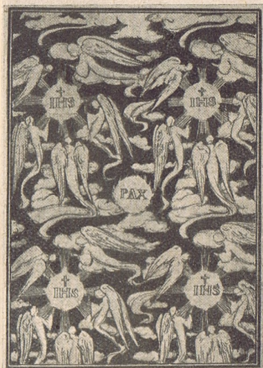
Részletrajz a Szentatya pluvialéjából.