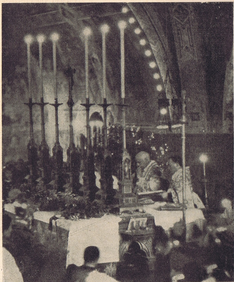
Merry del Val bíbornok miséje az Assisi Szent Ferenc-bazilikában okt. 4-én.