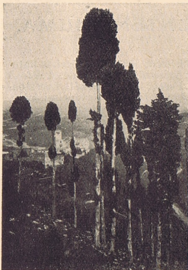
Assisi látképe, háttérben Umbria völgyével, közepén a S. Francesco-templom.

ban Szent Péterben nagy egyházi ünnepek voltak, mely napon délután öszentsége maga is megjelent a Szent Péterben szent Ferenc adorálására. Magyarországon, a Szent Ferenc Jubileumi Bizottság programja szerint a belvárosi Ferenceseknél három napos ájtatosság előzte meg azt a szent Ferenc jubiláris ünnepeket, melyet október 4-én tartottak meg, melyen a szentmisét Csernoch János dr.