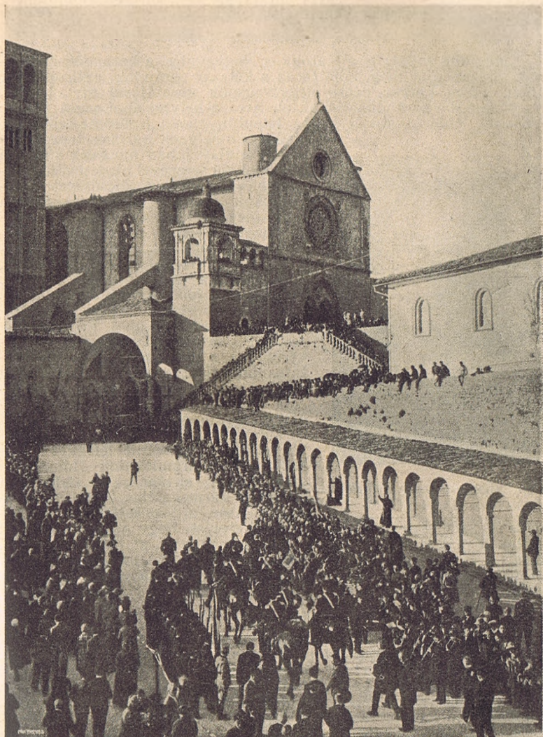
A bíbornok legátus fogadtatása Assisiben október 3-án.