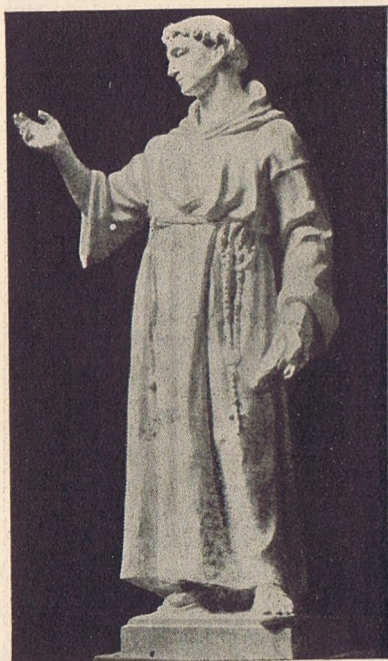
Martinelli Jenő : Szent Ferenc.

— Az alapokból igyekszem az esztergomi katolikus művészeti gyűjteményt gyarapítani, ahová a hercegprímás Őeminenciájával együtt működve San Marco hercegnő hagyatékát is beutaltuk, amely számára ugyancsak közös erővel vásárlásokat is eszköz- lünk.