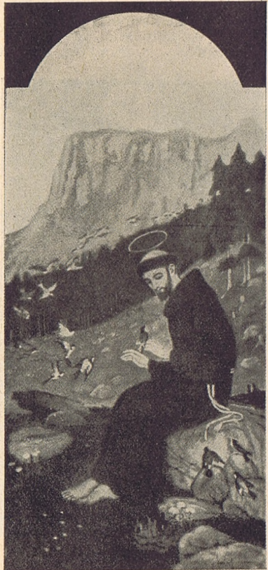
Biró József : Szent Ferenc a madarakkal. (Az első festészeti díjat nyerte.)

— A trianoni katasztrófa elszakította tőlünk a gyulafehérvári , a kassai , a pozsonyi dómokat, nekünk csak azok a területek