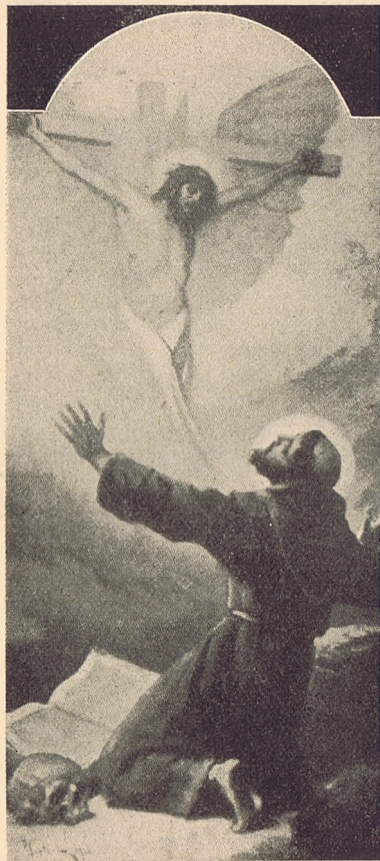
Éder Gyula: Szent Ferenc stigmaticiója.

Az Egyházművészeti Kiállítás pályázatot hirdetett sokszorosításra alkalmas plakát tervére is. Tizenheten vettek részt a pályá-