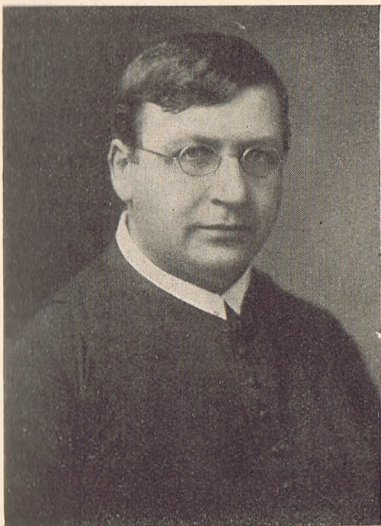
Dr. Serédi Jusztinián, a vatikáni követség kánonj. tanácsosa.

Franciaország: Mgr. Maglione Lajos c. érsek, ap. nuncius;