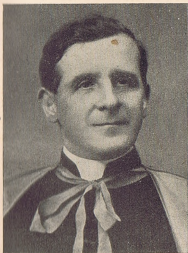
Pizzardo József a rendes egyházi ügyek államtitkára.