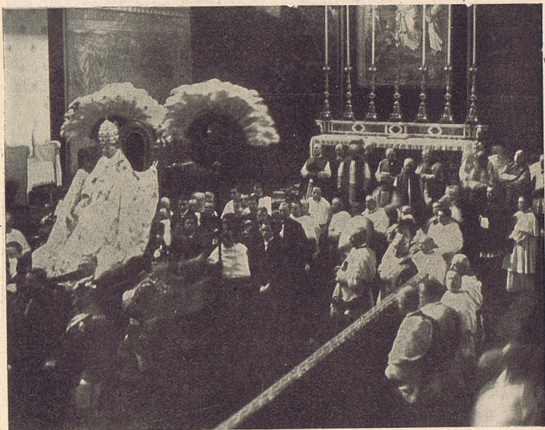
A pápa udvarával bevonul a Szent Péter-templomba.