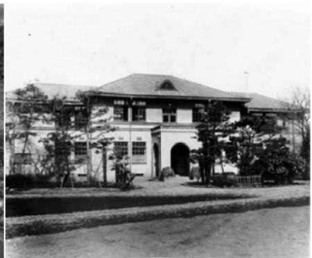
A Takinogawa Intézet területe (Kunitachi, Yabo-kerület) és főépülete (1930 körül)