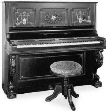
Fudeko „angyali” zongorája (ez a legrégebbi Japánban készített zongora, J.C. Doerinc, Yokohama, 1885)