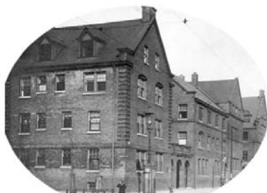
Hull Ház (1892)