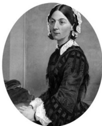
F. Nightingale (1870 körül)

Gustave Emile Boissonade, a francia jogtudós, aki a japán törvényhozás rendszerének nemzetközileg is helytálló új rendszerét segítette kidolgozni, mind a büntetőjog, mind pedig a polgári jog területén.