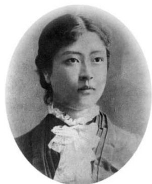
Ishii Fudeko (1880 körül)

Fudeko Nagaszaki tartomány Ohmura településén született 1861-ben. Legidősebb gyermeke volt Watanabe Kiyoshinak, az Ohmura klán egyik legrangosabb szamuráj vezetőjének (születési név: Watanabe Fudeko). Az Ohmura klán szövetségese volt a Tokugawa-shōgunátust megdöntő Satsuma és Choshu klánok alkotta reformot követelő csoportnak. A Meiji-restaurációban és az új államszervezet kialakításában is aktív szerepet játszott mind édesapja, mind pedig öccse, Watanabe Nobori. Fudeko hét éves volt, amikor a Meiji-restauráció kezdődött, így aktív szemlélőjévé és családja révén részesévé vált az újkori modern japán társadalom kialakulásának. Édesapja egyik pártfogója és barátja, a korszak egyik legjelentősebb politikai alakja, Katsu