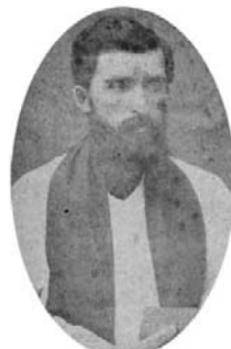
Reverend Blanchet (1881)