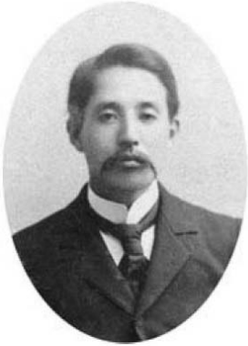
Ishii Ryoichi (1896)