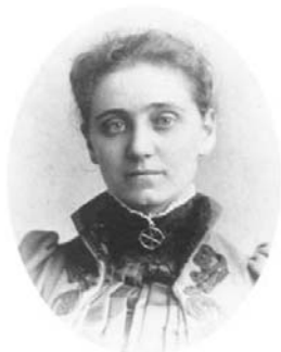
Jane Addams (1892)