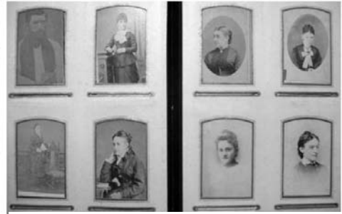
Fudeko Kék-albuma nyitva

A Fudeko-hagyaték egyik vezető kutatója a jelen történeti tanulmány második szerzője. Emiatt van lehetőségünk arra, hogy az eredeti, 1800-as évek végén készült képek digitalizált változatával teljesíthetjük ki a jelen munkát.