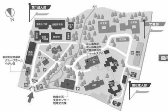
A Takinogawa Intézet mai térképe

Az egyik játékfilmet nemzetközi filmszemléken is bemutatták, többek között Los Angelesben és Londonban, így annak angol feliratos változata is elkészült ( Fudeko & the Angel's Piano ). A Takinogawa Intézet a mai napig működik mint iskola, szociális védőmunkahely és mint jóléti kutatóintézmény, amely az akadályozottsággal élő emberek életminőségét és szociális integrációját kívánja javítani és segíteni.