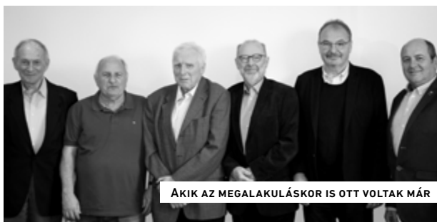
AKIK AZ MEGALAKULÁSKOR IS OTT VOLTAK MÁR