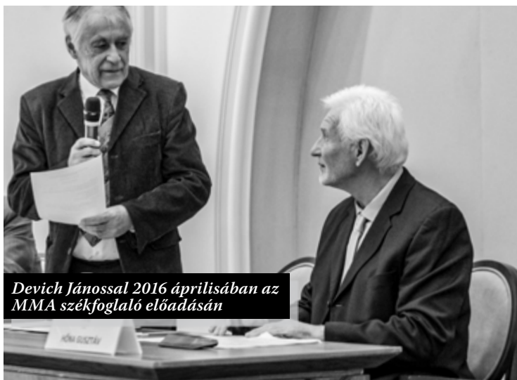
Devich Jánossal 2016 áprilisában az MMA székfoglaló előadásán

Az együttes szellemiségét és összjátékának minőségét kitűnően érzékelteti 1986-ban megjelent önálló lemezük egyik tételcíme. Ránki György nekik írta a lemez címadó darabját, a Hétfejű sárkány szerenádját (Hungaroton, SLPX 31003). A hét fej valójában a hét játékosra utal, egységüket pedig az első tétel alcíme, a „ Hét fej, egy lélek... ” fejezi ki. Ránki hamarosan a már említett Lúdapó meséivel lepte meg a muzsikusokat (nem véletlen, hogy Hőna Gusztáv e kitűnő darab köré építette székfoglaló előadását 2016. április 15-én a Magyar Művészeti Akadémián). Az együttes által előadott kortárs darabok közé tartozik még Farkas Ferenc Rézfúvószenéje , Dubrovay László Szeptettje és Berregő polkája , Hidas Frigyes Edzsminták sorozatának néhány darabja, Szabó Csabától a Szonáta rézfúvósokra , Lendvay Kamillótól az Öt pökhendi ötlet fúvósszextettre , továbbá Lamberto Gardelli, Hans Hütten és Vukán György kompozíciói.