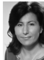
Lejegyezte: Réfi Zsuzsanna

Három évtizeddel ezelőtt alakult meg a szimfonikus zenekarok szakmai szövetsége