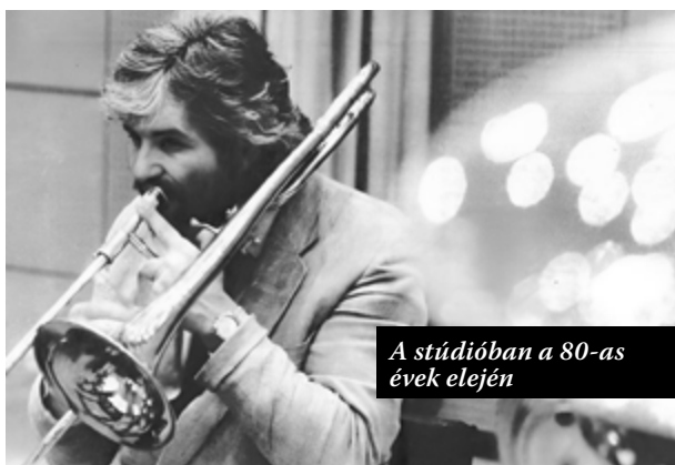
A stúdióban a 80-as évek elején