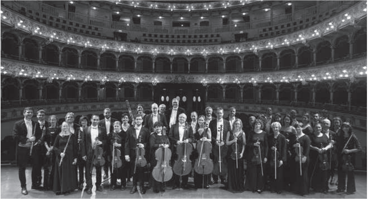
A Kodály Filharmonikus Zenekar

■ Voltak olyan kezdeményezések is, hogy majd a budapesti zenekarok leutaznak koncerteket tartani vidékre, és megoldják az ottani területek zenei ellátását.