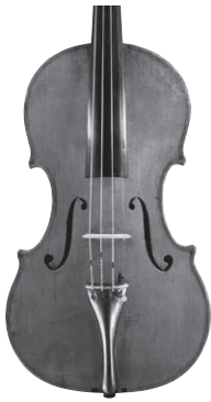
A „Roth” hegedű (Chi-Mey Múzeum, Tajvan)