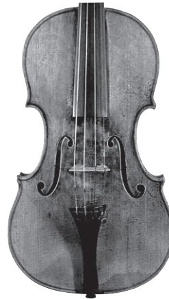
A „Polgár” hegedű