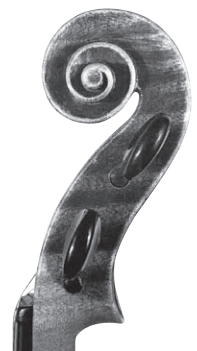
A „Belházy” hegedű csigája