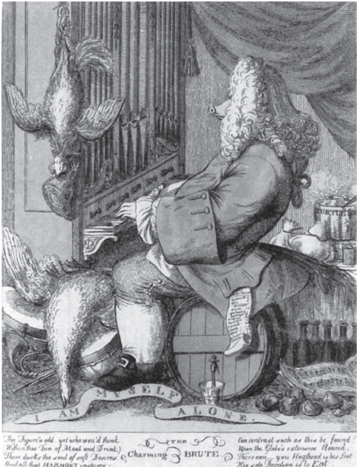
Joseph Goupy karikatúrája Händelről

repeltette a kürtöt (96.), vagy hogy Velencében álarcban csembalózott, az éppen jelenlévő Scarlatti azonban még így is felismerte: „ez csakis a hírneves százsz lehet, vagy pedig maga az ördög” (57).