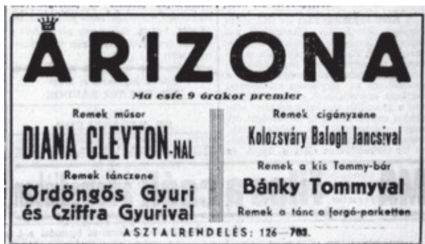
Az Arizona hirdetése 1942 szeptemberében

November 18-án a rádióban lépett fel Paganini és Liszt La campanellájával , Dohnányi f-moll etűdjével és Liszt Spanyol rapszódijával . A művész maximalizmusát ismerve ehhez heteken át ismét komolyan és szisztematikusan kellett gyakorolnia. Ezt követően évekig ki-