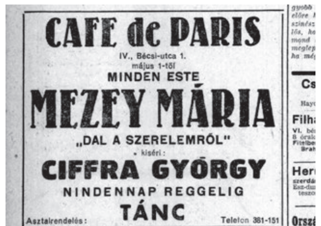
A Café de Paris hirdetése, 1949. május