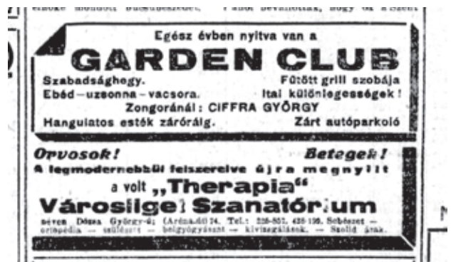
A Garden Club hirdetése, 1946. október

Garden Klubban, decembertől minden nap a Capri szalonban, a következő év nyaratól a Füzék borozó-étterem kerthelyiségében, 1948-ban a Luganóban, majd a Café de Paris-ban. Országos ismertségre tett szert, mivel esti szerepléseit rendszeresen közvetítette a rádió, és számos alkalommal játszott a stúdióban is egyedül vagy másokkal. Emellett vidám esteken, például Latabár Kálmán zenés műsoraiban működött közre a fővárosban és vidéken egyaránt. Mezey Mária színésznő énekét nemcsak a kávéházban, hanem önálló zeneakadémiai estjén is kísérte. Lépésről lépésre haladt előre a távoli cél felé, miközben már jelentős anyagi és erkölcsi megbecsülésben részesült – majd ismét bekövetkezett a katasztrófa, és folytatódott Afanaszjev vándor Katonájának lázálomszerű repülése.