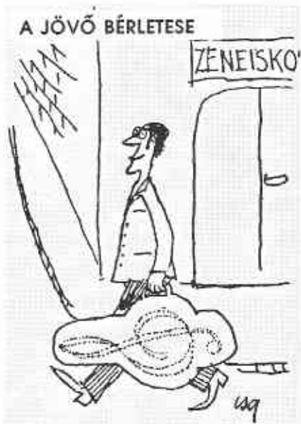
A JÖVŐ BÉRLETESE