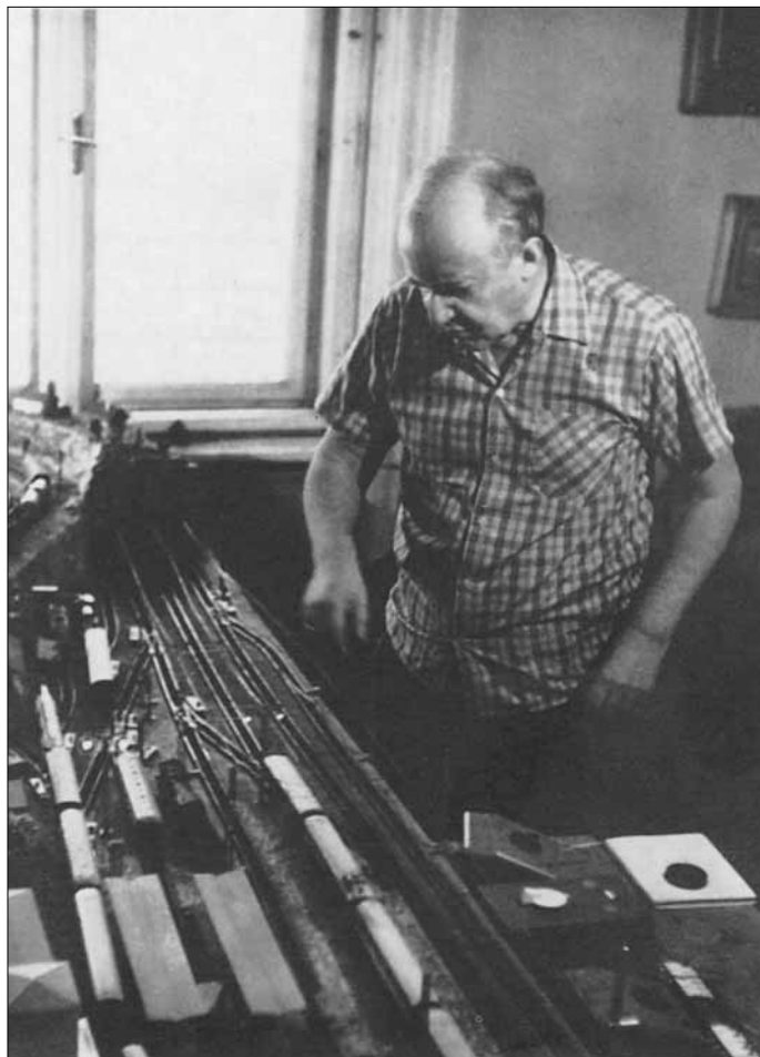
Pihenő, játék a kisvasúttal