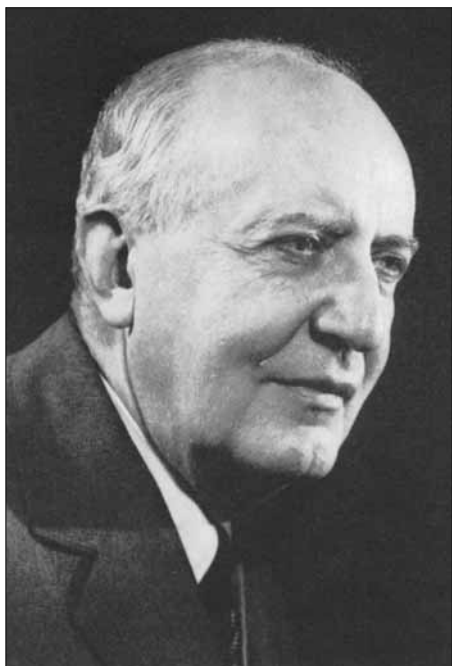
A zeneművész pályája csúcán, az 1960-as évek elején