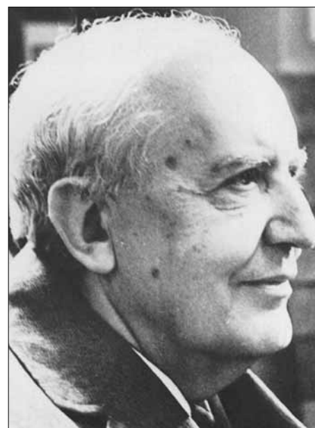
Az idős mester, 1974

A Szegedi Nemzeti Színház 1984-ben Vaszy-díjat alapított; évente egy énekes, karmester, táncművész kapja a zenés társulat titkos szavazása alapján. Csongrád megye jeles kóruskarnagyait, jutalmazza 1984 óta Vaszy Viktor Emlékéremmel. 1993-ban, 90-ik születésnapjának esztendejében emlékkönyvet adott ki „Vaszy Viktor emlékezete” címmel Szeged önkormányzata. A zeneszerzőt is nagyobb becsben tartotta választott otthona a fővárosnál. Nem tudom, tartja-e becsben mindmáig.