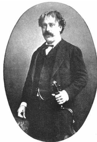
Pablo de Sarasate

A művet előadó művész számára tér nyílik, hogy próbának vesse alá magát, meddig terjednek képességei, ugyanakkor a cél mégiscsak az, hogy a zeneművet ne tegyék tönkre. Az előadó segítségére lehetnek a híres, tehetséges lengyel hegedűművésznő, Eugenia Umińska gondolatai: »Nagyon nehéz pontos és részletes útbaigazítást adni ennek az igen dinamikus műnek az eljátszásához. A művésznek képességeihez mérten leginkább a cigány előadói stílust kell utánoznia. Ezt a legjobban úgy érheti el, ha meleg, erőteljes hangon, temperamentumosan játszik. Ezt az erőteljes, improvizatív játékművet mindenképpen a megadott ritmus és a természetes zenei lüktetés határain belül kell alkalmazni. Ezen határok tiszteletben