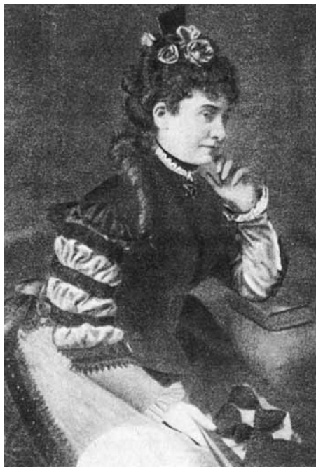
Szentirmay felesége, akinek a „Csak egy szép lány” című dalt ajánlotta. Üveglapra festett kép, Párizsban készült 1878-ban.

bele kicsinyített hasonmásban abba a zsebkönyvecskébe, amelyet a magyar kiadó az 1878-as párizsi kiállításra jelentett meg költőnk műveiből... Nyilván ennek a révén ismerte meg Jules Claretie francia regényíró...” (Claretie magyar tárgyú, „Le prince Zilah”, 1884-ben megjelent regényének egyik fejezetében ír a „Csak egy szép lány” c. dalról, fűzi hozzá Kerényi.) Az előbbi információhoz kapcsolódva említjük, hogy a Vasárnapi Újság 1878. július 2-i számának „Mi újság?” című rovata a világiállításról tudósítva ad hírt a párizsi magyar csárdával és az ott hallott zenével kapcsolatban Jules Claretie-nek, az „Independance Belge” című lapban közölt, elragadtatott hangvétellű beszámolójáról.