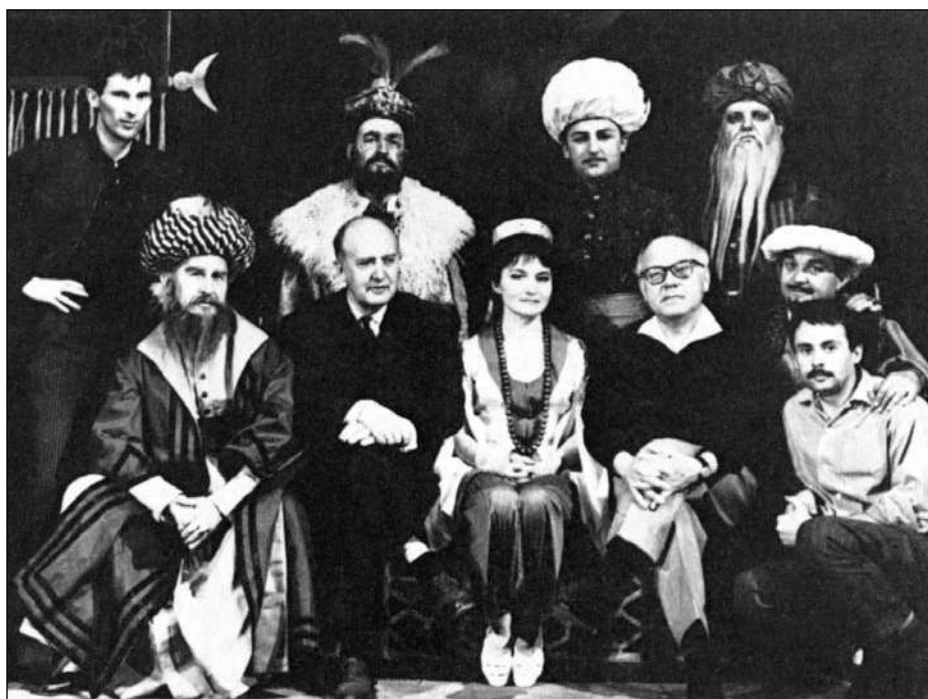
Farkas Ferenc: A bűvös szekrény – bemutató, 1966