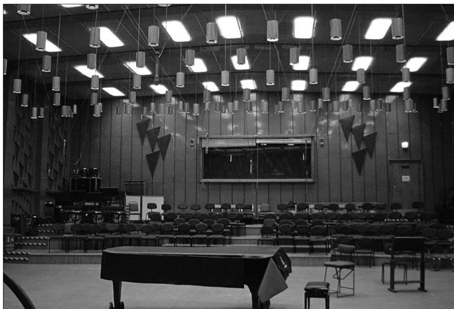
A hatos stúdió napjainkban