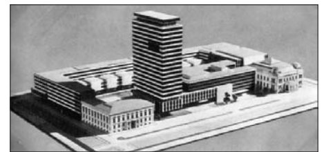
Az ÁÉTV tervnek a Rádió jelenlegi telephelyére szánt makettje. (Nánási Sándor, 1966.)

A Rádió műsorstruktúrája időközben módosult (megjelentek a kereskedelmiek