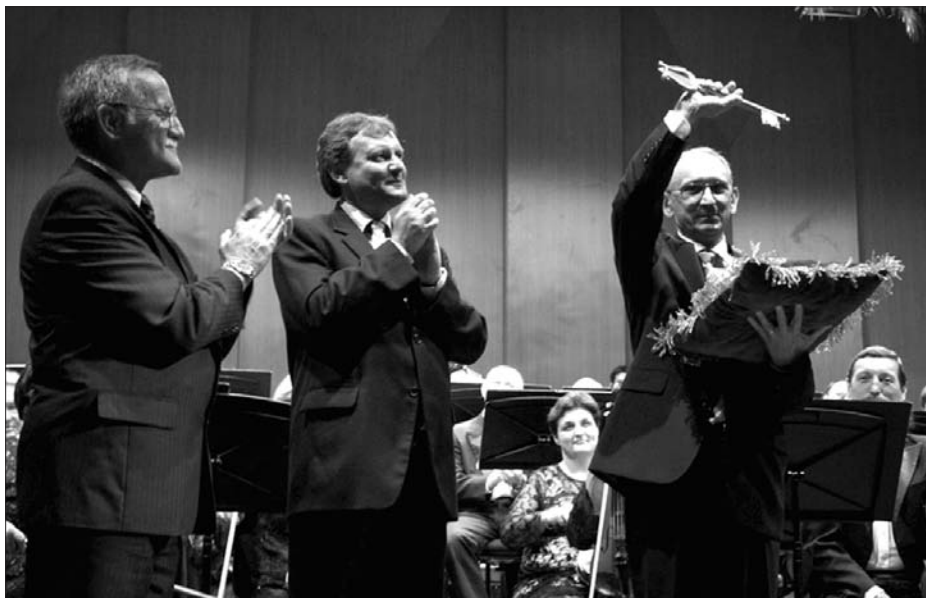
Sir László átveszi az épület kulcsát

építkezéshez. Új szárnyak nőttek ki a földből, az akusztikusok pedig átalakították a ház belső termét. Jelentős volt ez az átépítés, hiszen két art mozi is készült, 70 és 140 férőhellyel, emellett konferencia-terem és kiállítórész is akad az épületben. A nagyteremben 600-an tudnak leülni. Ez a méret számunkra szinte ideálisnak mondható, hiszen a négy bérletsorozatra 620-620 bérletet adunk el, így a törzsközönségünknek csak néhány tagja szorul ki, ezt a problémát azonban igyekszünk úgy megoldani, hogy több, bérleten kívüli koncertet is adunk majd. Annak is örülök, hogy mostantól kezdve egy másik napon, csütörtökönként találkozhat velünk a közönség. Persze ez az átállás sem olyan egyszerű, hiszen a publikumunk életében óriási változást jelent.