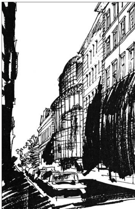
A tervezett koncertterem Múzeum utcai homlokzata

A 90-es években a kérdést hangmérnöki oldalról ismét felmelegítettük ugyan, ám próbálkozásunkat most meg a tervezett Világkiállítás ürügyén az illetékes