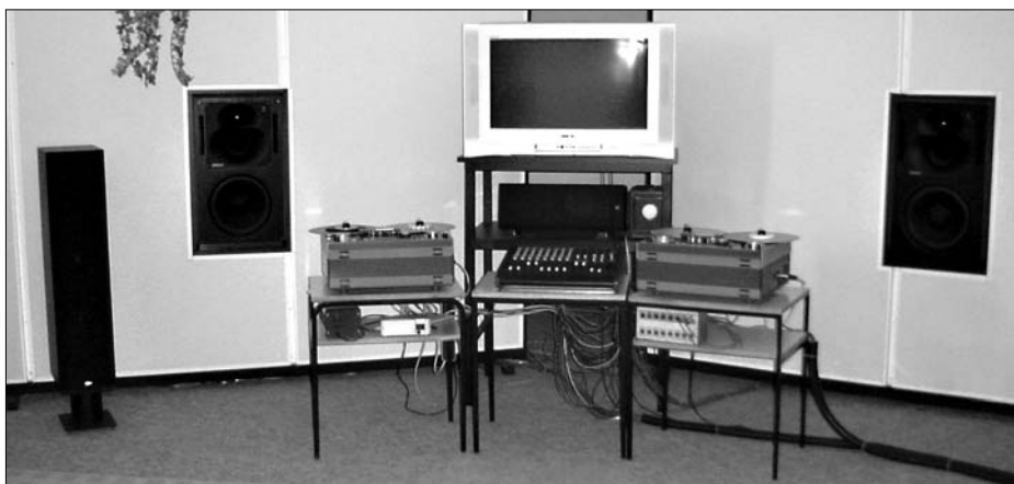
A Szent István Király Zeneművészeti Szakközépiskola hangkultúra tanterme

Éppen e lap hasábjain szükségtelen hangsúlyoznunk, hogy a zenetanulás mennyire törekeny. Vannak, akik elszánt zenei elhivatottsággal jönnek a konzervatóriumba, majd csakhamar kiderül, hogy választásuk nem volt szerencsés: vagy a tehetség, vagy a kitartás hiányzik belőlük. Sok-sok órányi hangszeres gyakorlással a hátuk mögött ilyenkor a hangkultúra szakra átmenve lehetőségük van arra, hogy kipróbálják magukat egy másik – de lényegében rokon – területen, hiszen ha nem is lesznek zeneművészek, de a szükséges felsőfokú tanulmányaik végeztével attól még kitűnő zenei rendezők, szerkesztők, hangmérnökök és akusztikusok lehetnek. S a közös tantárgyak révén az átjárhatóság az első évfolyamokon még mindkét irányban lehetséges. Ha pl. egy felvételizőnk hangszeresen még nem éri el a konzervatóriumi szintet, de a felvételi bizottság „lát benne zenei fantáziát”, akkor átmenetileg bekerülhet a hangkultúra szakra, ahol a zenei tárgyakat úgyis tanulja, s ez sokkal előnyösebb számára, mintha a zenétől távol egy gimnáziumban várná a későbbi sikeres hangszeres felvételt. Ám arra is van példa, hogy egy „hangkultúrás”, megelégvén a blokkvázlatokat és a decibelleket, inkább neki áll gyakorolni, s még idejében átmegegy egy hangszeres szakra. Ez az átjárhatóság nagyon fontos, hiszen tanulóinkat a „bele-erőltetés” helyett abban kell segítenünk, hogy a felkínált lehetőségek között megtalálják leendő hívatásukat. Ezért az első évfolyamokon a hangkultúra és a zenei szakok közötti átjárást nem gátoljuk.