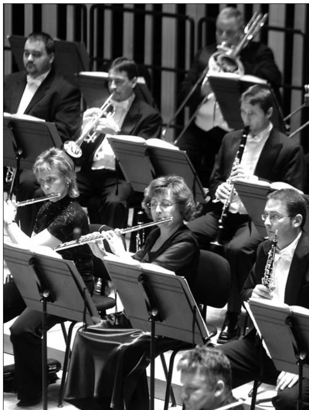
A Győri Filharmonikus Zenekar