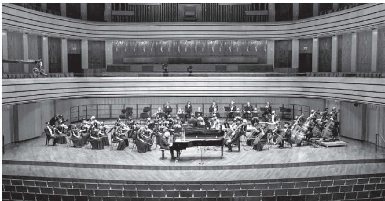
Pannon Filharmonikusok online hangversenye – Fotó: Pályi Zsófia, Müpa

Az Esz-dúr zongoraverseny nyitótételének alaphangját Ránki határozta meg a kezdő szóló lehengerlő maestoso karakterével. Ettől kezdve az ő zenélésének alapvető nyugalma és integráló ereje határozta meg az egész előadást. A mű kivételesen gazdag érzelmi és karaktergazdagságát egységes és monumentális megnyilatkozássá integráló szellem azonban Bogányi Tibortól sem idegen, és ő zenekarával együtt kiváló partnernek bizonyult Ránki számára, aki mögött az elkenéstől mentes, tiszta körvonalak, a hangzás és a zenei kisugárzás intenzitása, a tartás nemessége terén sem maradtak el. A szólista egy-egy fejmozdulata is jól érzékeltette a folyamatos kapcsolatot, az együttlélegzést közte és a karmester meg a zenekar között. Különösen magával ragadóan jelentették meg a zene ellágyuló pillanatait, és feltűnt, hogy a pianissimók is mennyire intenzívek, telítettek, koncentráltak voltak. A lassú tétel elején szuggesztív tömörséggel szólalt meg a szordinált vonóskar, a kürtök lágy, simogató játékát pedig tanítani lehetett volna; de az egész hangköltemény a megragadó líraisága és komolysága is maradéktalanul hallhatóvá vált. A zárótételt kirobbanó energia hajtotta előre, s Ránki magasrendű zenélését nem csupán briliáns zongorázás jellemezte, hanem az a