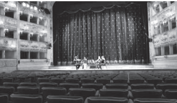
„The show must go on”, avagy közönség nélküli, online streamelt koncertek a pandémia idején

Apple megváltoztatja a fizetési platformjának a működését, illetve csökkenti a jelenleg 30%-os adót. 2020 szeptemberében a használat még csupán bizonyos országokra korlátozódott (összesen 20 országban volt elérhető, Magyarország nem szerepelt a listán), 2021 elején azonban már Magyarországon is működik.