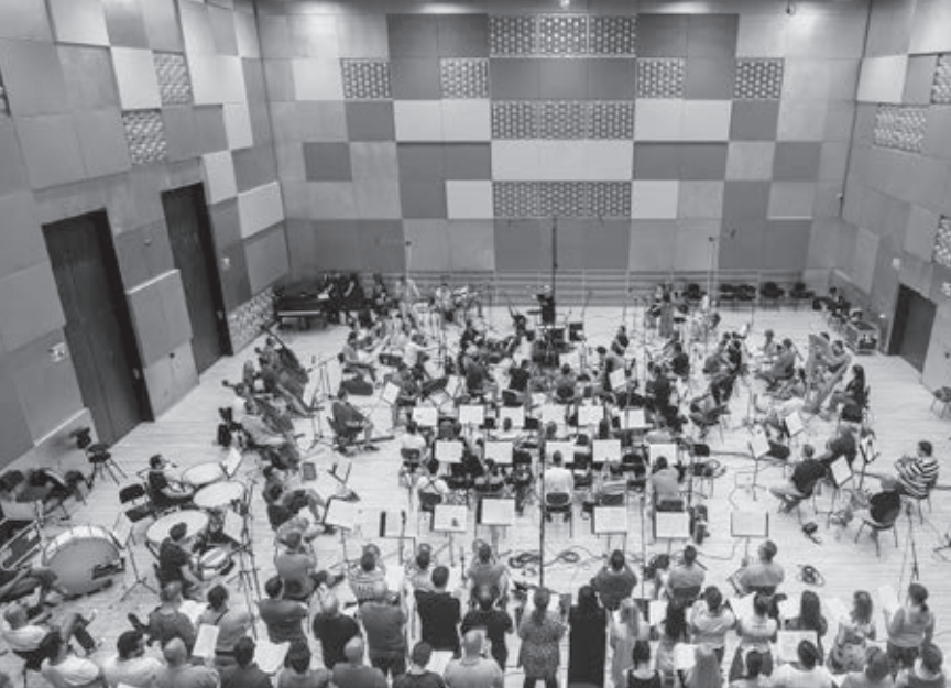
Fricsay Ferenc Stúdió. Fotó: Berecz Valér

repertoárjának kialakításánál, vagy nincsenek ilyen határok?