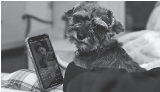
Az élő közvetítéseket akár kanapénkról, mobilunkon is követhetjük

A sávszélesség és a tárhely függvényében különböző havidíjak fejében használható a platform, közel 40$/hónapos összegtől, azonban, ha nem folyamatosan szeretnénk streamingelni, csupán egy-egy egyedi eseményre használnánk a platformot, személyre szabott ajánlatot is kaphatunk a szolgáltatótól. A streamingekből és közvetett videókból származó bevételgenerálás is több módon valósulhat meg: a platform lehetőséget nyújt az egyes előadások, közvetítések után történő részvételi díj