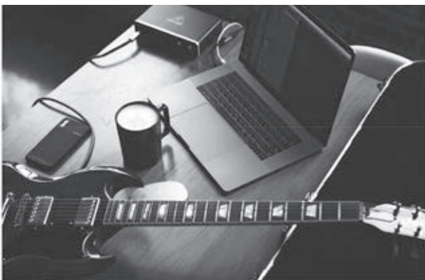
Az új koncertterem akár a nappalink vagy az irodánk is lehet

A fentebb bemutatott platformok előnyeit és hátrányait a 48. oldalon található táblázat foglalja össze.