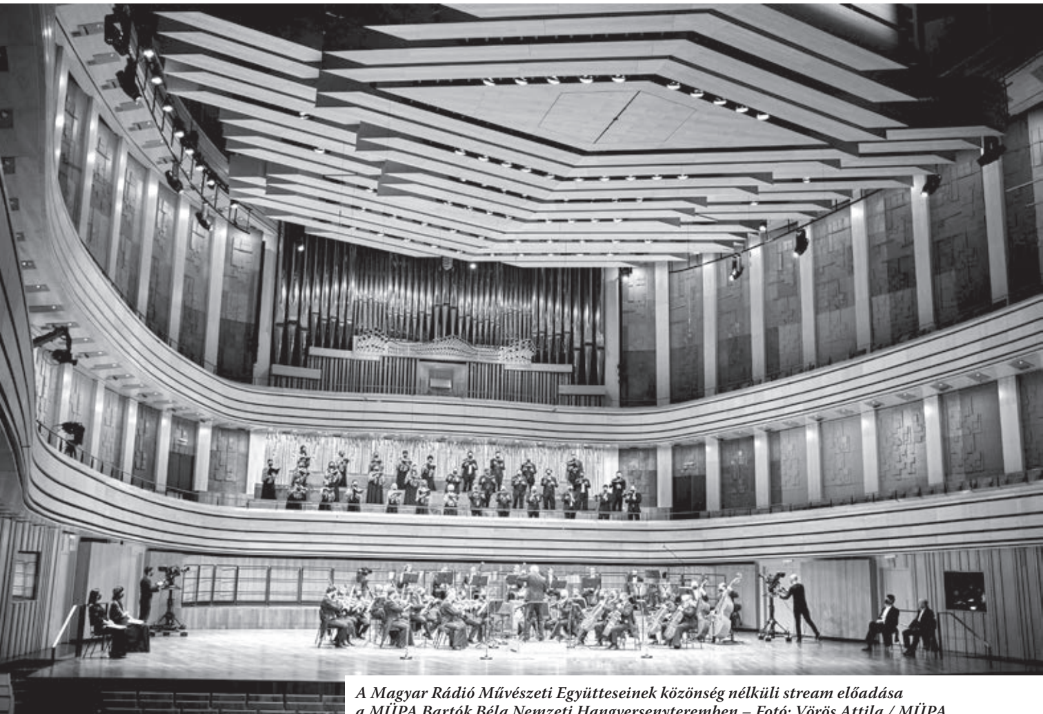
A Magyar Rádió Művészeti Együtteseinek közönség nélküli stream előadása a MŰPA Bartók Béla Nemzeti Hangversenyteremben – Fotó: Vörös Attila / MŰPA

Készült a Magyar Szimfonikus Zenekarok Szövetsége 2020. dec. 14–15-én végzett felmérése alapján.