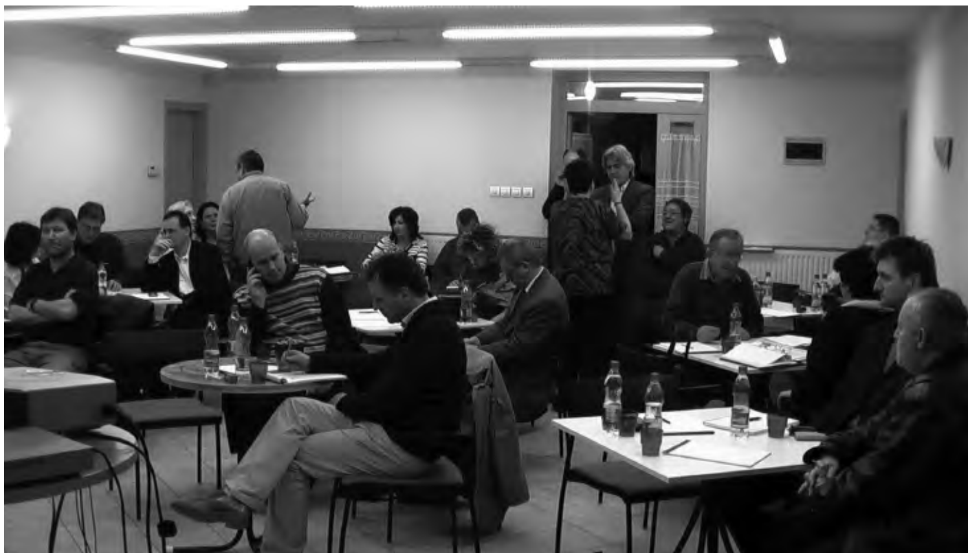
Kötetlen fomában zajlik a munkaanyagok megbeszélése Zamárdiban