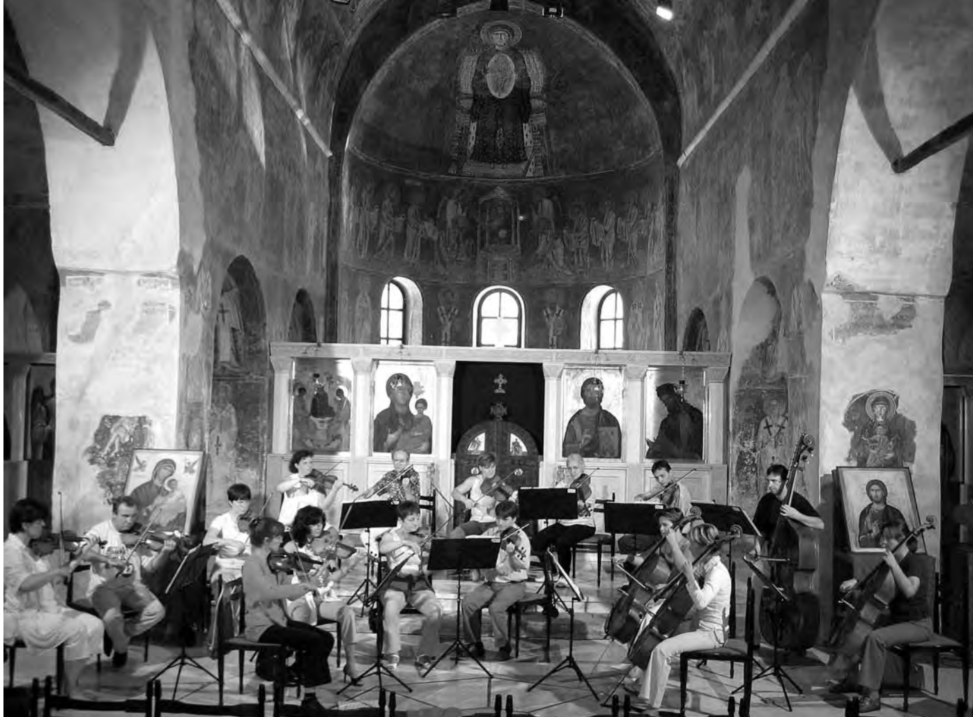
A MÁV Szimfonikus Zenekarból alakult kamaraegyüttes