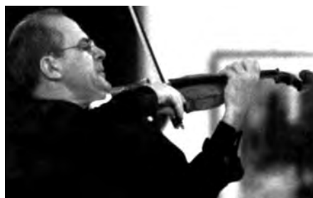
máig is elnöke a versenyt rendező alapítványnak. 1990 óta az esseni Folkwang Főiskola hegedű professzora.

Sajnos én a helyzetet elég pesszimistán látom. Az iskolának nagy szerepe van abban, hogy a gyerekek és fiatalok megszeressék a zenét. Úgy látom, hogy ez alacsony fokon vesztett jelentőségéből. Ez igen sajnálatos. A zenére specializált általános-