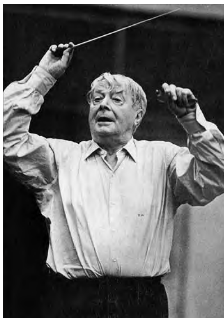
Charles Münch – Amikor még világsztárok dörögáltak a Rádiózenekart