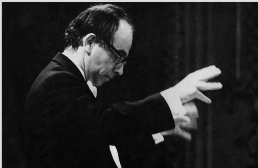
Archív kép a '80-as évekből