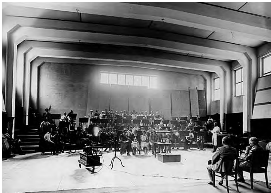
A 6-os stúdió akusztikai próbáin Dohnányi Ernő és Békésy György

Döntő jelentőségű, hogy nagyszerű muzsikusok irányították a zenei programokat: elsőként Kern Aurél, majd 1931-től Dohnányi Ernő – megnyerve a hazai előadóművészi élet színe-javát, és bemutatva a magyar zene romantikus alkotásait éppúgy, mint az új hangját kereső fiatal zeneszerző nemzedék legfrissebb termését. Szinte valószínűtlenül nagy a mindennapi élő adásokban pár esztendő alatt foglalkoztatott muzsikusok száma, a legjelentősebb művészekről a szórakoztató zenei műfajok képviselőiig, szimfonikus zenekarainktól, hivatásos kórusainktól és öntevékeny dalárdáinktól a legkülönfélébb kamaragyűjtéseken át a divatos szalonzenekarokig.