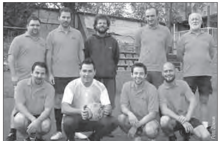
A Pannon Filharmonikusok – Pécs csapata