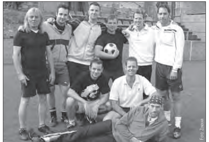
A Budafoki Dobnányi Ernő Szimfonikus Zenekar csapata