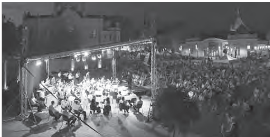
A Szolnoki Szimfonikus Zenekar a Tisza-parti szabadtéri előadáson

A nyár közepén, július 16-án a Zuglói Filharmónia – Szent István Szimfonikus Zenekar exkluzív környezetben, a Vajdahunyad