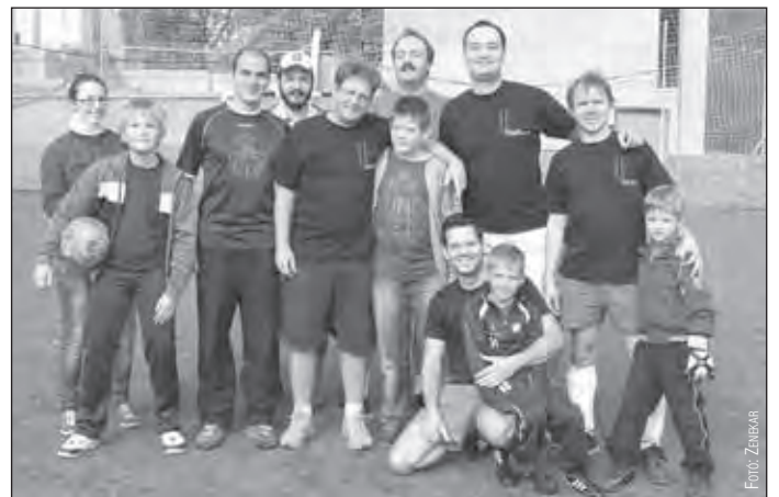
A Liszt Ferenc Kamarazenekar csapata