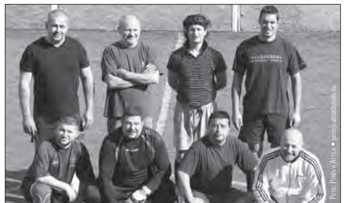
A Nemzeti Filharmonikusok csapata