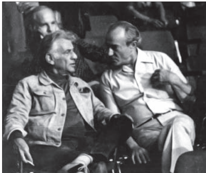
Leonard Bernstein és Ferencsik János

toár is a nagyobb létszámú szimfonikus művek irányába bővült. Ugyanakkor az is igaz, hogy akkor nem voltak duplázó fúvósok, és mindenki végigjátszott egy teljes koncertet, tehát a fúvósok nem váltották egymást. De fiatalon ez nem tűnt olyan megterhelőnek, mint most így visszatekintve. Nagy motivációt jelentett az is, hogy az ember egy ilyen komoly presztízssű zenekarban játszhatott.