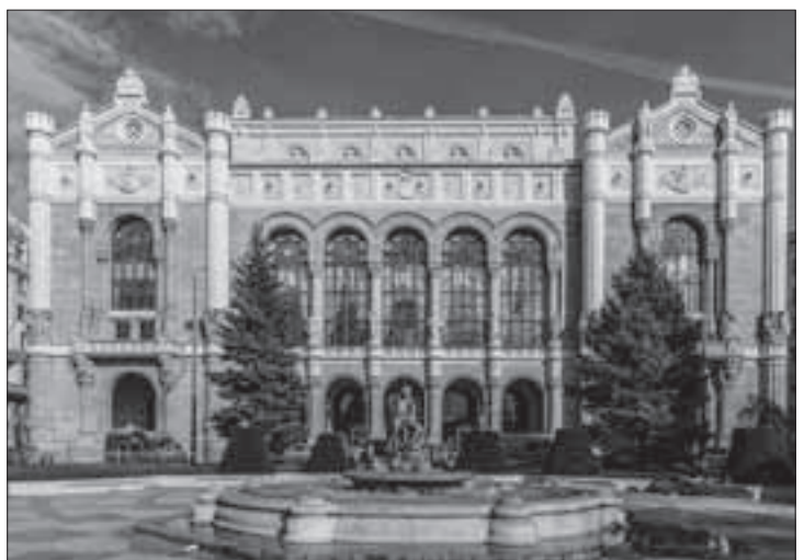
A 150 éves Pesti Vigadó