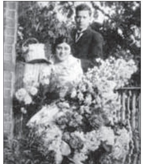
Zimbalist és Alma Gluck esküvői képe (1914. június 15., London, Cornwall Terrace 10.)