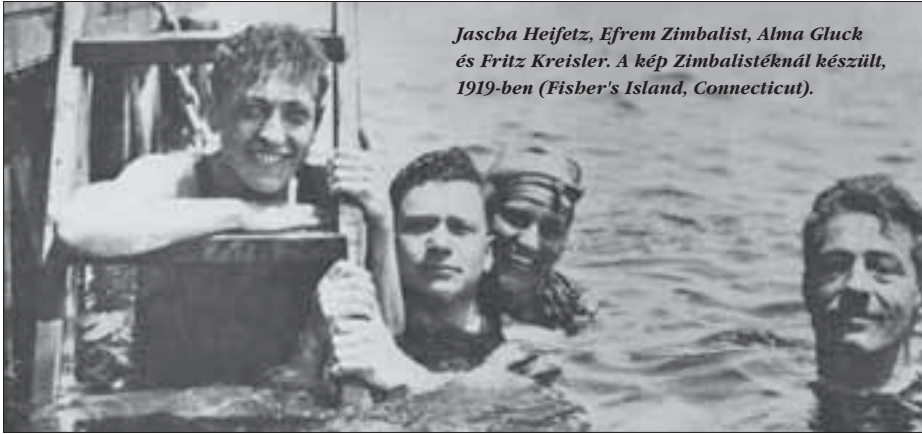
Jascha Heifetz, Efrem Zimbalist, Alma Gluck és Fritz Kreisler. A kép Zimbalistéknál készült, 1919-ben (Fisher's Island, Connecticut).