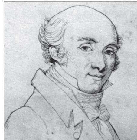
Giovanni Battista Viotti

Giovanni Battista Viotti (Fontanetto da Po 1753–1824)