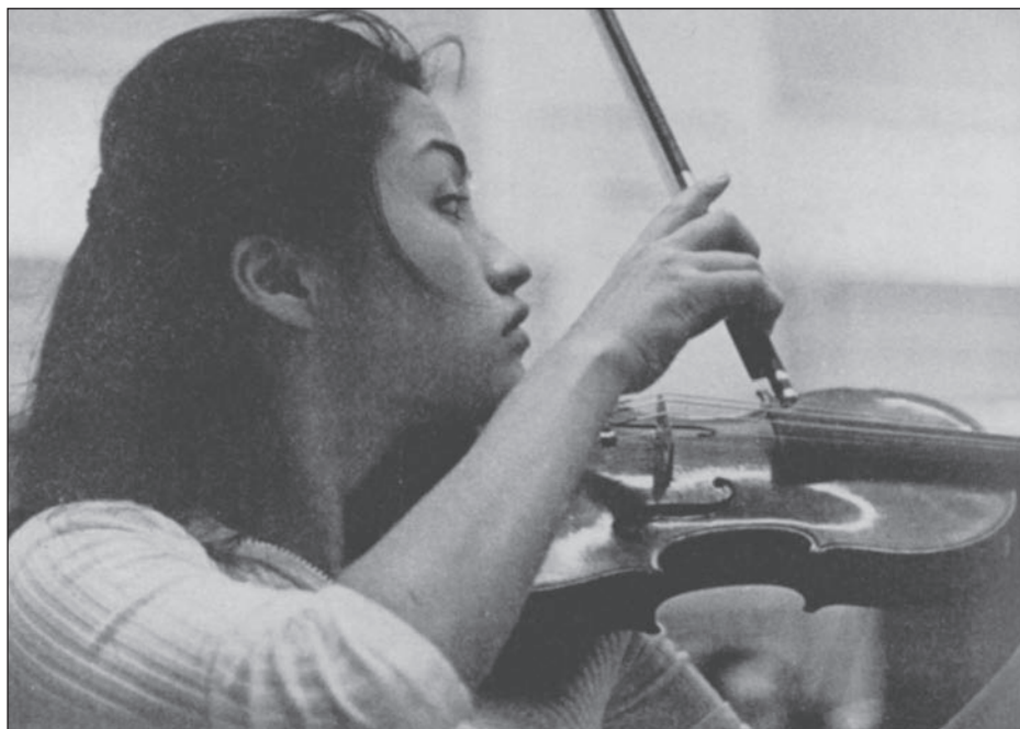
Kyung-W ha Chung