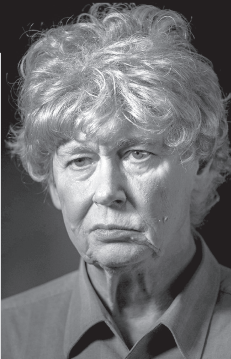
A felvétel Bartók Béla A csodálatos mandarin című balettjének próbáján készült a Művészetek Palotájában 2016. október 5-én