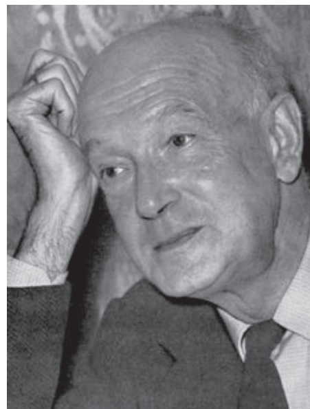
Szigeti Budapesten (1963)