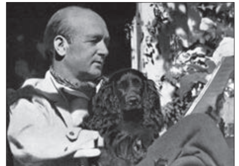
Szigeti Kaliforniában (1944)

Nyugalomba vonulását követően már nemigen tudott úgy előjátszani, mint korábban, bár amikor 70 éves korában hallottam gyakorolni – éppen Bachot játszott –, az kimagasló teljesítmény volt mind hegedűs szempontjából, mind pedig zeneileg. Nyilván zavarta, hogy megromlott a hegedűjátéka. De a feje még aktívan működött, és figyelmét minden lekötötte, ami körülötte történt. Nem én voltam az egyetlen növendéke, aki azon kapta rajta, hogy mások után „leselkedik”. Ha például zajt hallott kívülről, kinézett az ablakon és figyelte, hogyan tűnik el valakinek az alakja a bokor mögött. Én fiatal voltam, és ott volt a nagy Szigeti, aki fürkésző szemekkel figyelt. Próbálta ellesni, hogyan csinálom a repülő staccatót, vagy hogyan gyakorolok egy gyors tercmenetet a Paganini caprice-ban. A következő hegedűórán aztán elem állt, és bevallotta: „Hallgattalak, és szeretném ha megmutatnád, hogyan csinálod.” Megmutattam és megbeszélte. Tudta, hogy már nem fogja elérni korábbi teljesítményét, de még mindig tanulni akart. Mi mindannyian annak a kornak a gyermekei vagyunk,