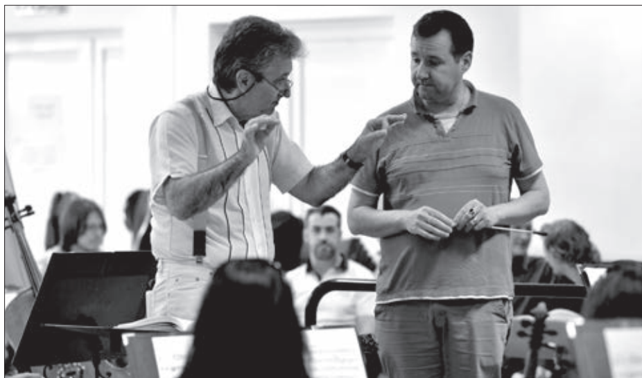
Karmester kurzus BDZ

A zenekar muzsikusai a nyarat intenzíven töltötték, mert a különböző kamarazenei formációk, a vonósnyegyesek, a pozan kvartett, a swing a la django vagy a fúvós kvintett is részt vett a fesztiválon, vagy egyéb rendezvényeken.