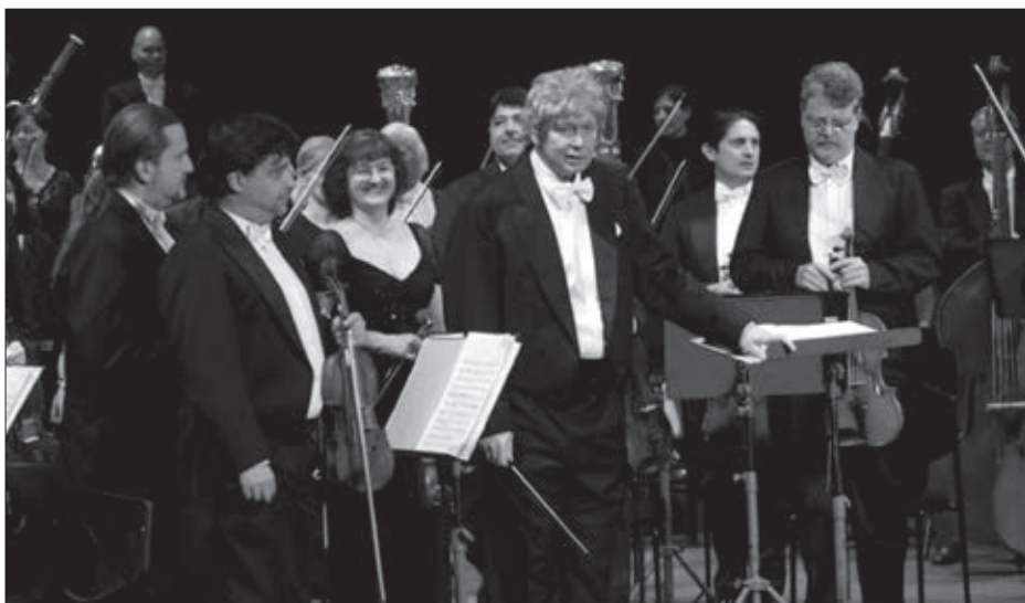
Záróhangverseny – Kocsis Zoltán és a Nemzeti Filharmonikus Zenekar