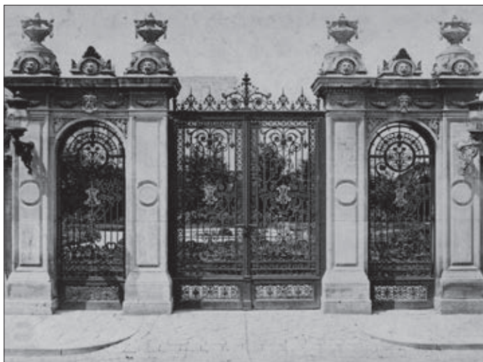
A Károlyi Palota kertjének bejárata az 1890-es években