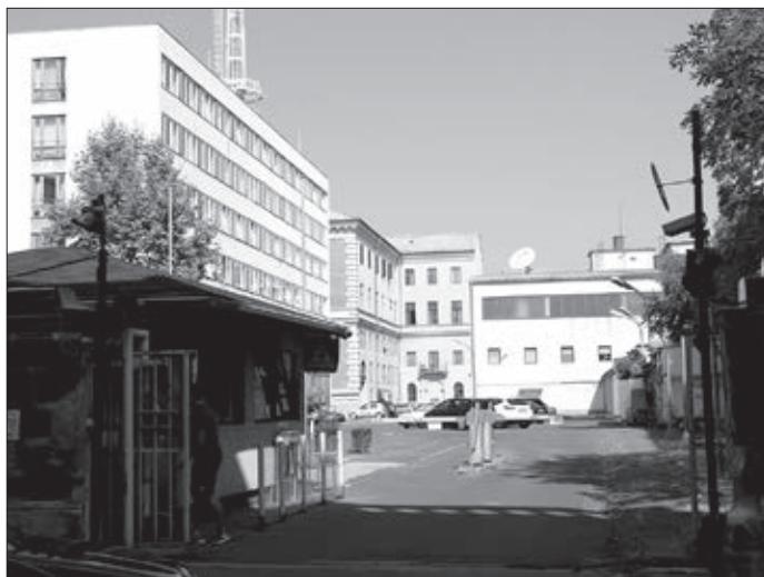
Az egykori bejárat ma teherporta. Háttérben jobbra a klímaház