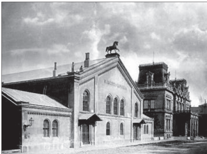
A Nemzeti Lovarda, amelynek helyén épült a „zöld” irodaház

mert ez az analóg technika hibái mellett már a digitális technika hibáit is tartalmazza. Az eredeti hanganyagok szakszerű megőrzése tehát nemcsak törvényi, hanem technikai szempontból is indokolt. És ha az Archívumnak költöznie kell, akkor kérdés, hogy hová? Remélhetőleg semmi esetre sem egy hatalmas, mindent magába foglaló központi archívumba, mert egy nemzetközi konferencián már több évtizede elhangzott: a nemzeti archívumok centralizációja azért nem javasolt, mert egy robbantásos akció nyomán egy szakterület teljes nemzeti kincse mehet veszendőbe. Ez a veszély pedig ma aktuálisabb, mint korábban bármikor!