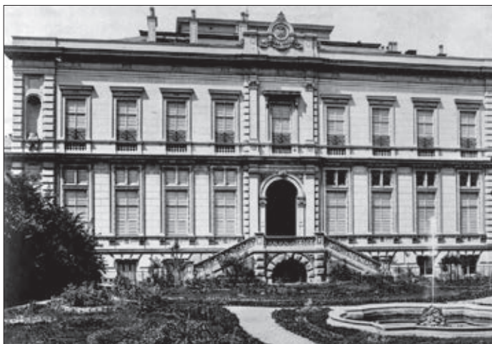
A Károlyi Palota bátsó, kerti homlokzata