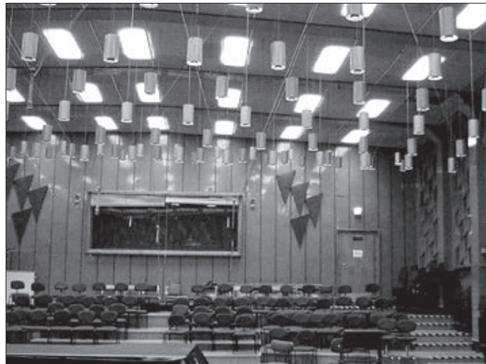
A 6-os stúdió