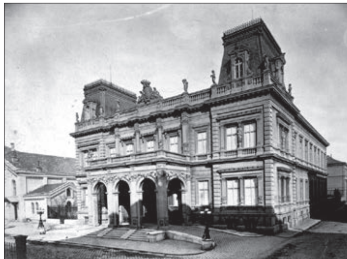
A Károlyi Palota az 1890-es években

minden megtalálható – egyelőre nem szerepel a tervekben. Ez év tavaszán azonban egy nagyon ígéretes tanulmánytervet mutattak be a Színház- és Filmművészeti Egyetemen arra vonatkozóan, hogy a Rádió épülettömbjét hogyan tudná hasznosítani a jelenleg meglehetősen sanyarú terem-és stúdió körülmények között működő intézmény. Az újabb fejlemények értelmében most már csak a Szentkirályi utca frontján működő stúdiók és irodák jöhetnek szóba, ám az egyetemnek feltehetően ez is nagy segítséget jelentene. Az öt emeletnyi irodát még évekkel ezelőtt hirtelen és rohammunkával kellett kiüríteni –, mellesleg a nagy sietségben ezért rengeteg hasznos rádiótörténeti dokumentum került a szemetes konténerekbe – hogy azután az épület azóta is üresen amortizálódjon. Ez is jól mutatja, hogy az átgondolatlan össze-vissza kapkodás, az újabb és újabb ötletek felbukkanása, majd eltűnése milyen károkat okoz az országnak. S hogy a dolgok alapos megfontolása mennyire hiánycikk manapság, azt pontosan ez az épület sorsa jelzi: míg az