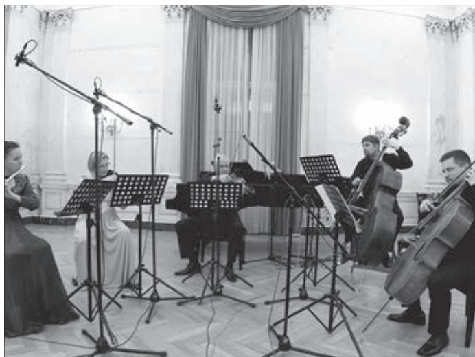
A Márvány-terem, ahol a kamarakoncertek zajlanak

A két újabb épület közül az üzemépület építészeti szempontból valamivel szerencse- sebb, mint az irodaépület, bár a Nemzeti Múzeumot tükröző üveg homlokfalát mindig kétkedéssel szemlélem, hiszen minék nézzem – az egyébként is vitatható – tükröképet, ha az eredetiben is gyönyörködhetek. Ám az üzemépület ma is jelentős, mert a Rádiómúzeum és legfelső szintjének korszerű műsorstúdiói mellett többek között kiszolgáló helyiségeivel együtt itt található a Rádió Archívum felbecsülhetetlen értékű gyűjteménye. A magyar kultúra és hangfelvételi múlt hangzó értékeit őrzik itt, gondosan kialakított klíma és tűzvédelmi körülmények között. Persze a „hozzáértők” részéről már elhangzott: minék egy analóg archívumot őrizgetni, mikor ugyanez digitális formátumban sokkal kisebb helyen elfér. Csakhogy a digitalizálás divatos bűv-szavának hangoztatása mellett egyről felejtkeznek el: az analóg hanganyagok digitalizálása nyomán létrejött másolat mindig gyengébb minőségű, mint az eredeti,