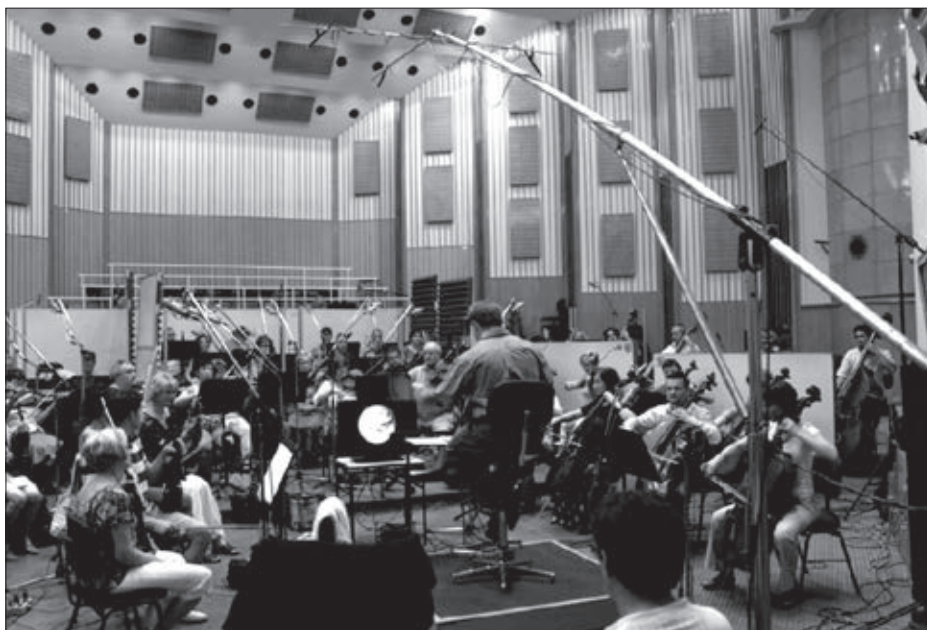
A 22-es stúdió

utca egyik oldalán lezárt, elhagyott stúdiók és irodahelységek árválkodnak várva a szebb időkre, addig a túloldalon az ország egyik legrégebbi és sikeresen működő egyeteme napi küzdelmet folytat a teremhiánnyal. Egyébként meggyőződésem, hogy a Nemzeti Múzeum, a Rádió és az egyetem együttműködése kialakítható lenne úgy, hogy az valamennyi fél számára előnyös legyen. A föld alatt már régóta létezik a szoros kapcsolat, ugyanis az egész épülettömböt jelenleg nehezen megbonthatóan köti össze, hogy az erősáramú központ az egyik palota pincéjében van.