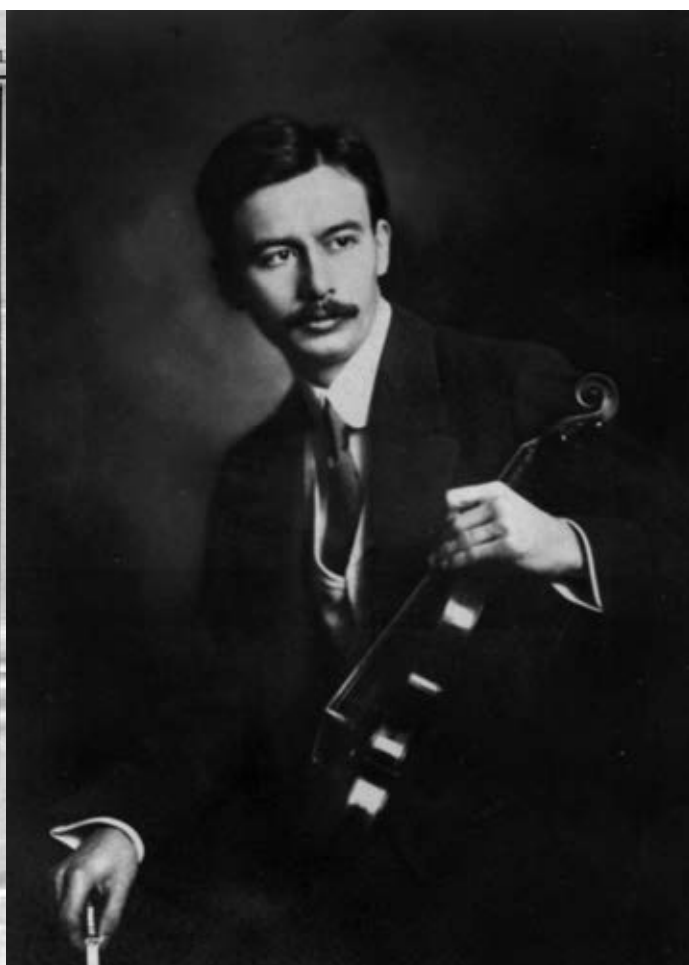
Vecsey Ferencnek „a hegedűsök hegedűsének”, 1921 novembere és 1922 februárja között megrendezésre kerülő 30 koncertjét beharangozó tudósítás, a Musical America 1921. február 26-i számában