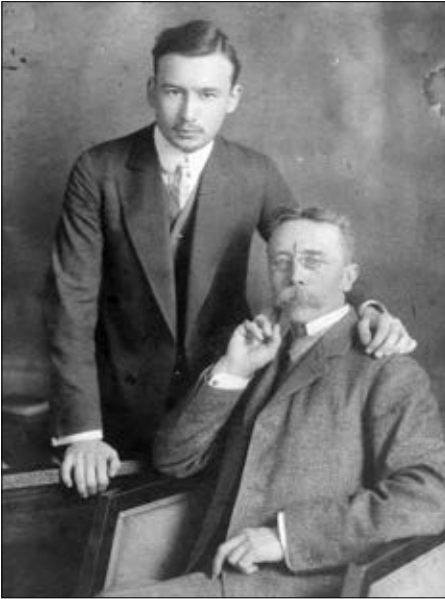
Vecsey Ferenc édesapjával, Vecsey Lajossal (1910)

1933. június 17-én Velencéből írja az Eckerman-koncertirodának, hogy a tél folyamán szívesen adna egy-két koncertet Göteborgban, és a zenekari koncerten a Sibelius-t játszaná.