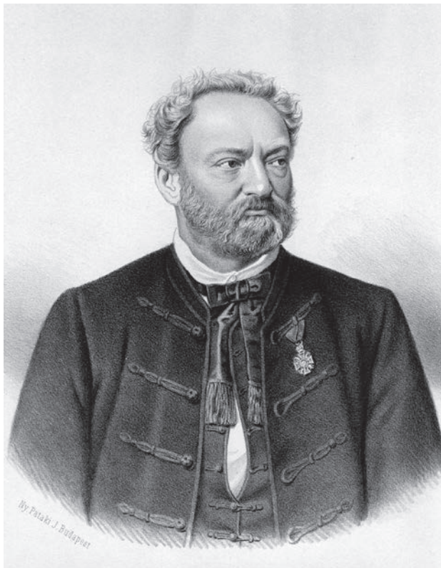
Erkel Ferenc portréja, 1878

A pályázat titkos volt, azaz a komponisták kilétét a zsűri sem ismerhette. Az anonimitást úgy biztosították, hogy a partitúrát idegen kézzel lemásoltatva kellett benyújtani, a kottára pedig a szerző neve helyett szabadon választott jelige került. A lepecsételt borítékba zárt nevek a zsűri döntése után sem hozták nyilvánosságra, így a sajtó csupán a sorszámokat és a jelígeket közölhet-