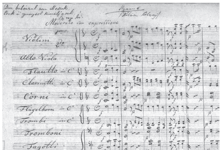
Ismeretlen szerző pályaműve „Bár babérral nem illettek...” jelíggel – részlet (Országos Széchényi Könyvtár, Zeneműtár)

Szintén a nemzeti könyvtár őrzi egy további Himnusz-megzenésítés két tenor és egy basszus szólamát, amelyek mellől hiányzik a nőikar és a kíséret anyaga. Az elő-, köz- és utójáték egykori meglétét egyértelműen bizonyítják a 8–8 ütemes szünet-jelzések. A „torzó” zenekari kíséretét és a hiányzó szakaszokat 1993-ban Sugár Miklós zeneszerző rekonstruálta. Különösen az előjáték stílushű muzsikája segítette a mű előadhatóságát, a hiányzó himnusz dallamot, a darab legfontosabb szólamát azonban ő sem pótolhatta.