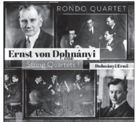
Dohnányi-vonósnégyesek I. (Rózsavölgyi és Társa Kiadó)