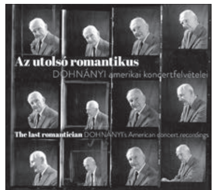
Az utolsó romantikus – Dohnányi amerikai koncertfelvételei (Rózsavölgyi és Társa Kiadó)