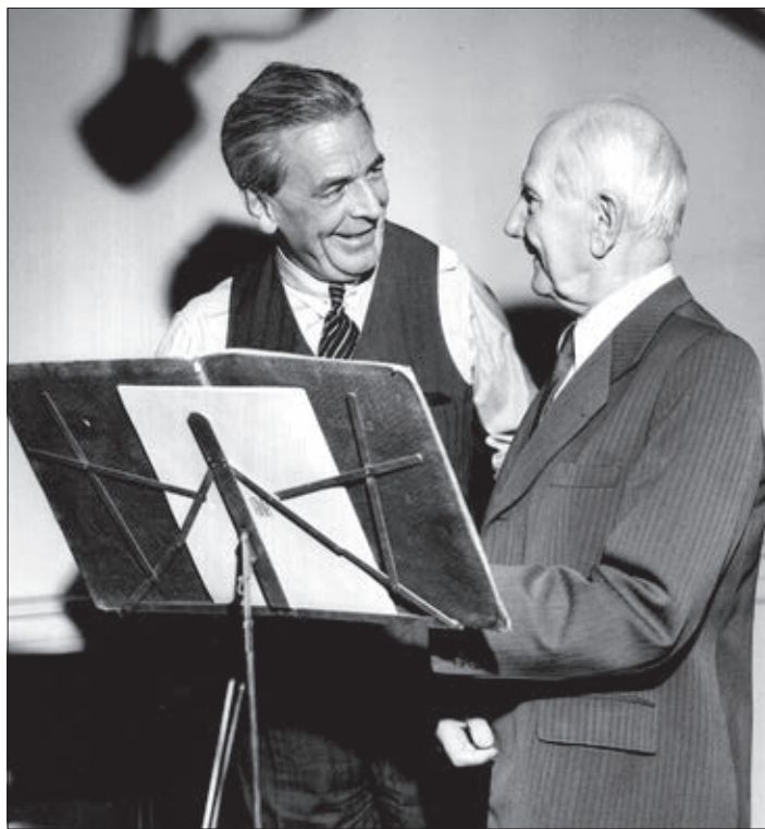
Albert Spalding és Dohnányi Ernő

Talán maga a zeneszerző sem gondolta volna, hogy egyszer lemeze játsszák majd fiatalkori kvartettjét. Az ifjú Dohnányi – bár még csak tizenhat éves volt az a-moll vonósnégyes komponálásakor – addigra már túl volt két vonóskvintett és egy zongoráskvartett megalakításán, mi több, a lemezen hallható a-moll vonósnégyes címlapjára büszkén kanyarinthatta rá: „III. Quartett”. A művet rekord gyorsasággal, mindössze másfél hét alatt – 1893. március 25. – április 5. között – vetette papírra. 1 Abból, hogy egy évvel későbbi zeneakadémiai zeneszerzés felvételi vizsgájára addigi kamarazenei terméséből éppen az a-moll kvartett egy tételét választotta ki, 2 arra következtethetünk, hogy ez utóbbival – vagy legalábbis a Scherzo tétellel – elégedett lehetett. A vonósnégyes-tétel minden bizonnyal a felvételi bizottságban helyet foglaló