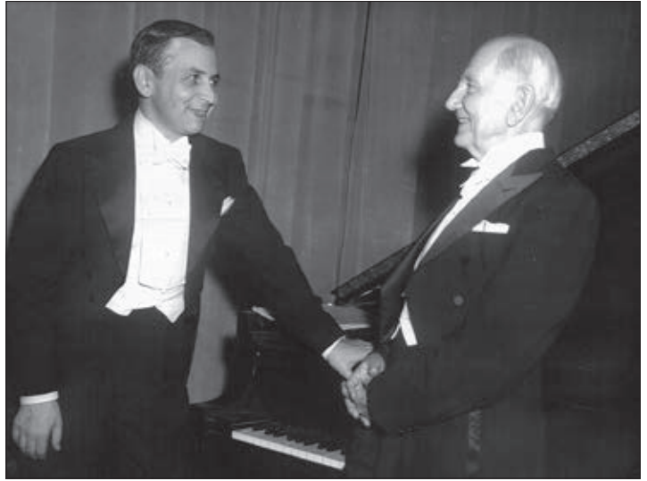
Kilényi Ede és Dohnányi Ernő

Ismeretlensége okán különösen sok felfedezni valót kínál az opusz-szám nélküli kvartett. Az ifjú zeneszerző ekkoriban komponált négyteteles kamaraműveinél már bevett gyakorlat, hogy előszeretettel cserélte meg a két belső tétel korábbi hagyományokat követő elrendezését: második helyre téve a scherzót, míg a harmadik tétel a lassú (ezt akár Haydn-tól is tanulhatta, aki szintén szívesen kísérletezett a hagyományostól eltérő – menüettet követő lassú – tételrendezéssel). A későbbiekben az érett kompozíciókban is jellemző lesz majd a szonáta ciklus ilyen tételrendje. Az pedig, hogy a műben feltűnően sokat szólózik a celló, bizonyára az édesapa felé tett gesztusként értelmezhető. Kusz Veronika – a sok hasznos információt közlő, gondosan szerkesztett lemezkísérő írója – úgy véli, hogy a jövőre utalnak a már itt meglévő hosszú, strukturált dallamok, a scherzo ironiája, a lassú tétel melankolikus, egyben nyugtalan hangvétele, valamint a variációs alapú gondolkodás is.