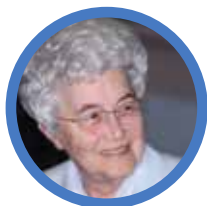
► Chiara Lubich //

A karácsonyi időszakban Jézus születéséről, és ennek kapcsán egyéb születésekről elmélkedünk. Egy pillanatra álljunk meg, hogy egy másik valóságos születésre is emlékezzünk, Mozgalmunk születésére.