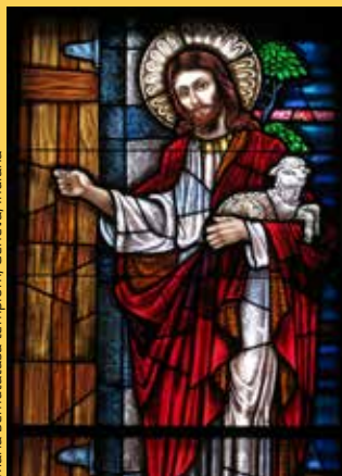
Mária bemutatása templom, Geneva, Indiana