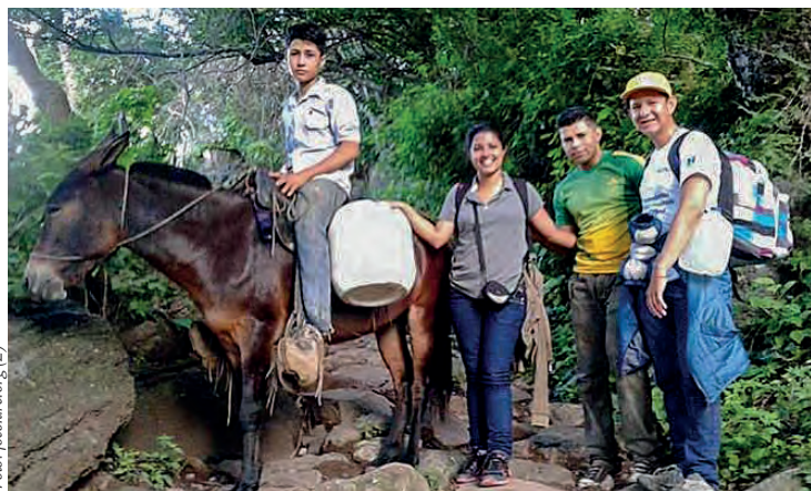
Fotó: focolare.org (2)

Forrás: www.focolare.org Fordította: Tóth Judit