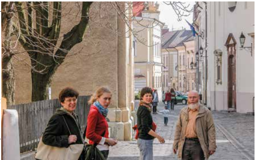
A Kormány család albumból (3)

Igen, még pedig szép számmal, például a Szombathelyről Kőszegre vezető út több kastélynak, kúriának fut neki, majd vesz előttük kettős kanyart, s megy tovább. A legjellegzetesebbek a Szent Imre herceg útja a Béke térnél, majd a Hunyadi út Gencsapátiban. Látványosabb esetei ennek a formának a római Szent Péter székesegyház előtti tér, amire a Via della Conciliazione elegánsan rávezet, de Bernini kolonnádjai előtt az autósforgalmat elterelik, az nem léphet be az ünnepélyes térre. Hasonlóképp az esztergomi bazilikára hosszú kilométereken át vezető út közeli szakasza, a Dobozy Mihály út a térhez közelítve elkanyarodik, s a hatalmas tér egyik oldalán