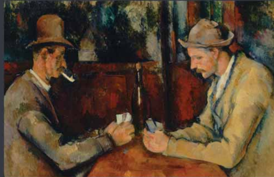
Paul Cézanne: Kártyajáték, 1890-1895 körül | Musée d'Orsay, Párizs