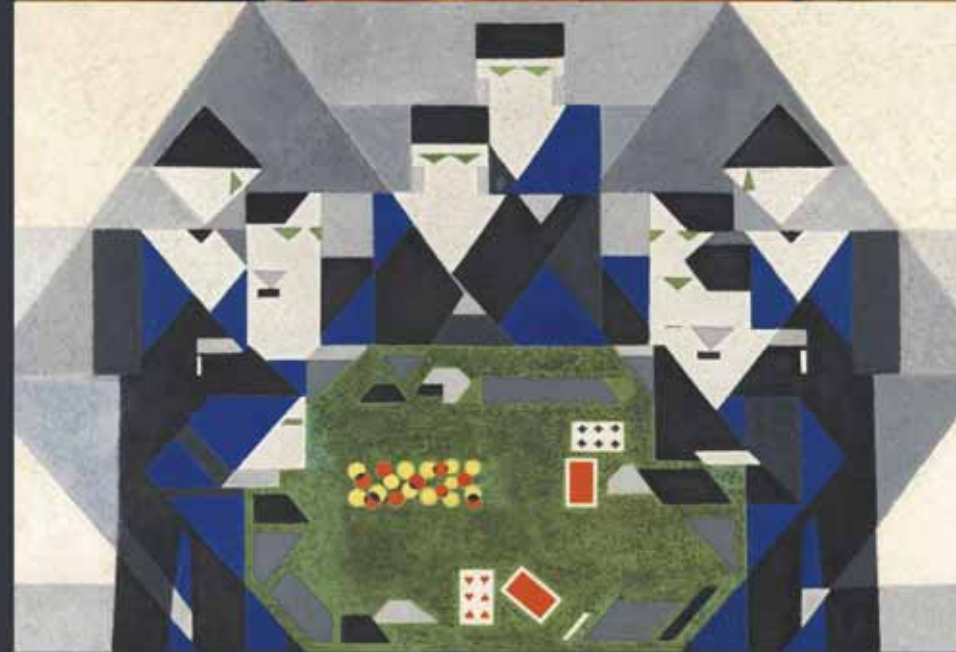
Marcel Duchamp: (Férfiak) Kártyajáték, 1911 | Musée National d'Art Moderne, Párizs

SZÉPMŰVÉSZETI MÚZEUM 2021. 10. 29. – 2022. 02. 13.