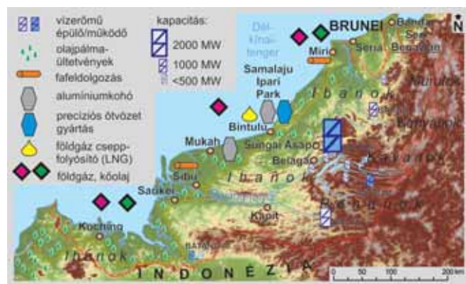
TÉRKEP: KARÁCSONYI DÁVID

Malajzia jelentős bevételekre tesz szert a kőolaj- és földgáz-bányászatból, a borneói fakitermelésből, az olajpálma-ültetvényekből. A nyersanyagokra épülő gazdasági növekedés az ország ritkán lakott, keleti, borneói tartományaira, Sabahra és főként Sarawakra jellemző. Sarawak állam a világ legnagyobb trópusi fa-és fűrészáru-exportőre. Eközben a Maláj-félszigeten fekvő, sűrűn lakott nyugati országrészben a korábban jelentős kaucsuktermelést és ónbányászatot idővel felváltotta az olcsó munkaerőre alapozott mikroelektronika-ipar és az autógyártás.