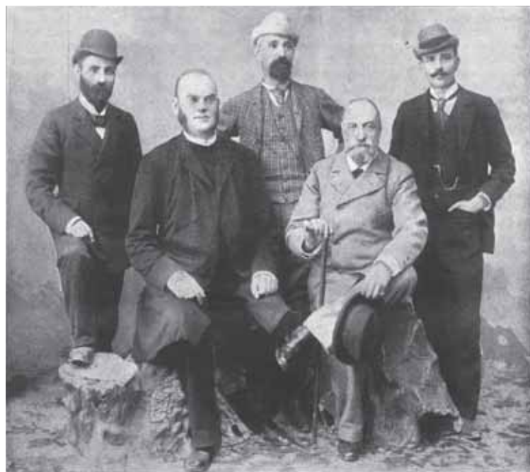
Gróf Zichy Jenő és útítársai