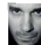
MORVAI SZILÁRD FÉNYKÉPÉSZ, A MAGYAR TÁJ TERMÉSZETI ÉRTEKEINEK BEMUTATÁSÁVAL FOGLALKOZIK

E 2-3 egyed valódi, helyi kedvencé vált, üde színfolt a Balaton ködös, szürke téli képében.